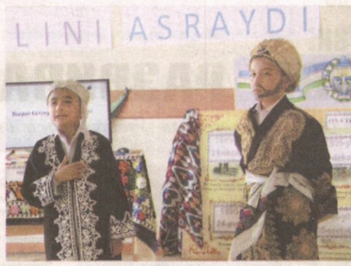
Классники рубаиата». Победители награждены памятными подарками.

На творческом вечере подведены итоги конкурсов сочинений и рисунков на тему «Я сын страны великих предков», «Люблю творчество Навои и Бабура», «Будем достойны великих предков», «Мы по-