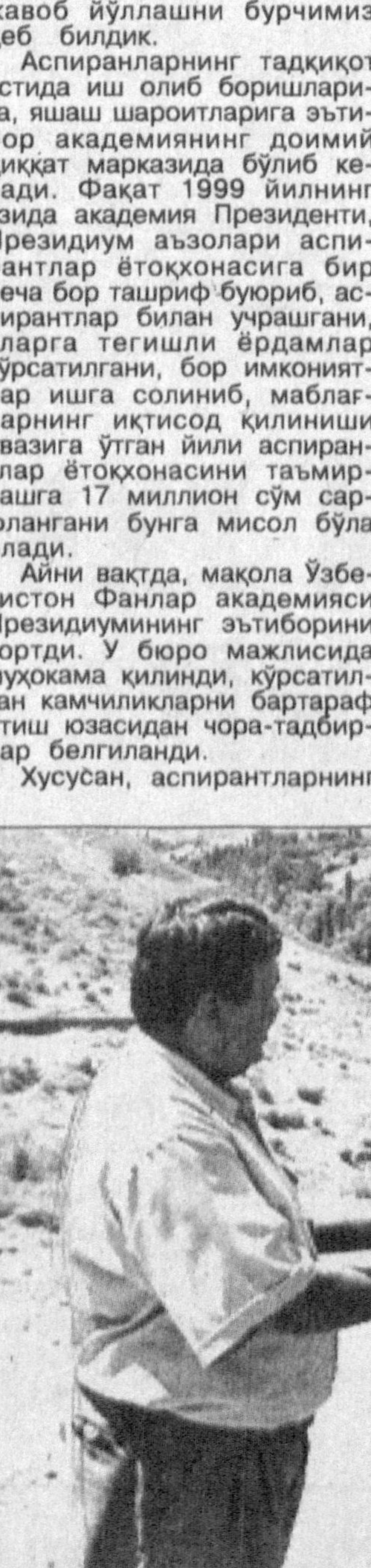
Секин юрсанг, узоқ яшайсан, болам...