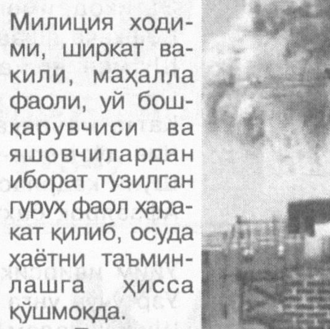
Милиция ходими, ширкат вакили, маҳалла фаоли, уй бошқарувчиси ва яшовчилардан иборат тузилган гуруҳ фаол ҳаракат қилиб, осуда ҳаётни таъминлашга ҳисса қўшмоқда.

ват этиб келаётган, эзгулигу инсонпарварлик гоёларига хормай-толмай хизмат қилаётган ва бу бекиёс сазй-ҳаракатлари жаҳон микёсида кенг эътироф этилаётган Ўзбекистон Республикаси Президентининг Баёнотида терроризмга муносабат масаласидаги Ўзбекистон позицияси ўзининг ёркин ифодасини топди. У ҳеч қандай шубҳа-ю иккиланишларга ўрин қолдирмади. Одамларимиз иродасини, эзгуликка, эртанги кунга бўлган ишончини мустаҳкамлади, тинчлик учун қатъий тўриб курашга чорлади. Шу тариқа осуда ҳаёт, тинчлик-хотиржамлик учун сўзда эмас, амалда астойдил сазй-ҳаракат қилиш ҳаётимиз мезонига айланди.