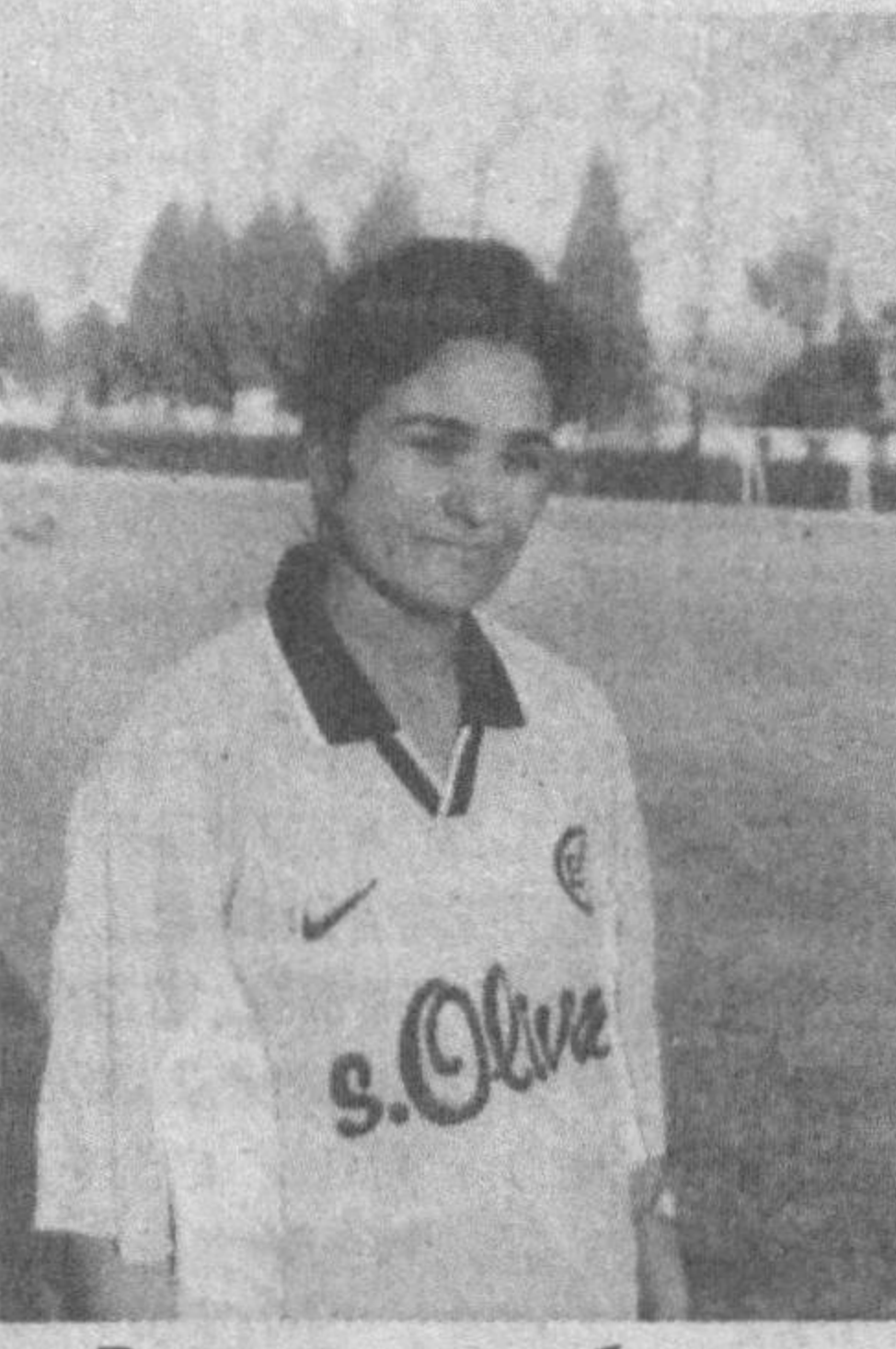
Вилоят касаба уюшмалари жисмоний тарбия ва спорт жамияти, унинг тасарруфидоги ташкилотлар меҳнат жомоалари, ўқув юртлари, яшаш ва ишлаш жойларида спортнинг оммавийлигини таъминлаш, соғломлаштириш ишларини ташкил этиш, қишлоқда спортни ривожлантириш, моддий-техника базасини мустаҳкамлаш, қобилиятли, иқтидорли, етук спортчиларни аниқлашга алоҳида эътибор бермоқда.

республика миқёсидаги спорт усталари, 500 дан ортиқ спорт усталигига номзодлар ва биринчи разрядли спортчилар етишиб чиқди. 20 та ўйингоҳ, 3 та отиш тири, 3 та сузиш ҳавзаси, 26 та зал, 434 та ҳар хил спорт майдончалари қуриб битказилди. Термиз шаҳрида жаҳон андозлари асосида қайта таъмирланган, 8 минг томошабинга мўлжалланган «Алпомиш» ўйингоҳи ишга тушди.