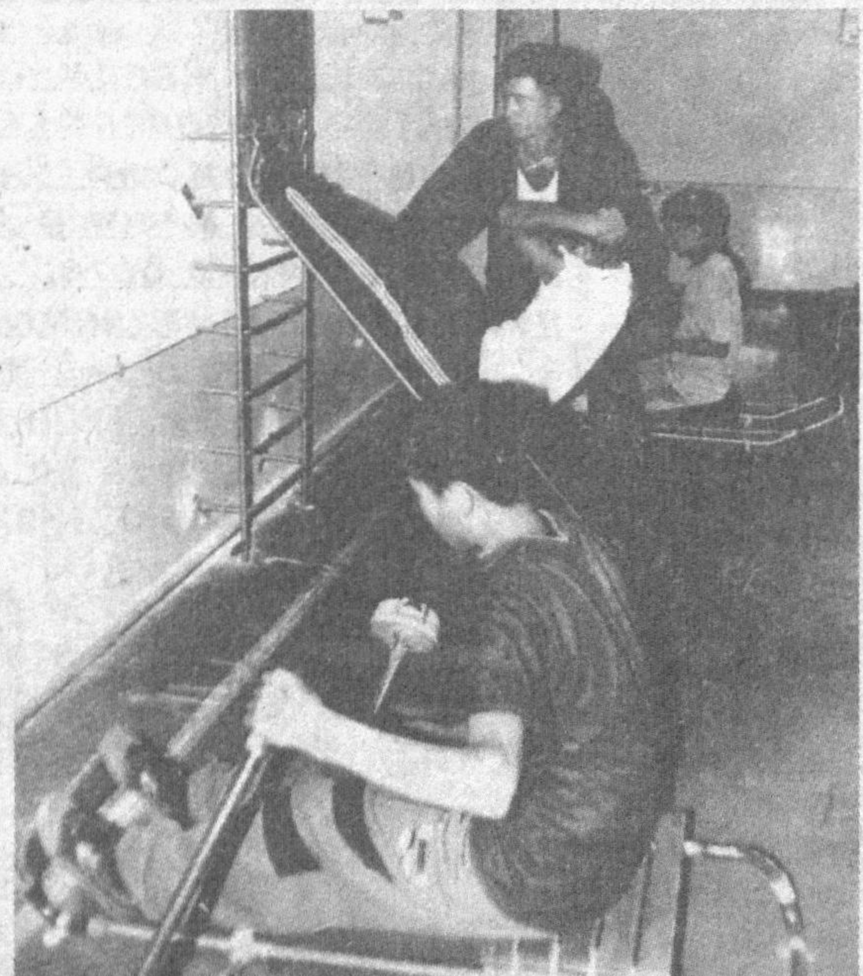
Езёвон туманидаги қишлоқ хўжалик касб-хунар коллежиди олти йўналиш бўйича мутахассислар тайёрланади. Қайта таъмирланган мазкур ўқув даргоҳида замон талабларига мос ўқув жиҳозлари мавжуд. Шунингдек, ундаги спорт зал, ошхона ва икки юз ўринли ётоқхонада яратилган шарт-шароитларни кўнгилдаги дек дейиш мумкин.

кўчаларини таъмирлаш, ичимлик суви қувурлари ўтказиш ва ободонлаштириш учун бюджетдан ташқари маблағдан 1,5 миллион сўм ажратилди. Шаҳар ҳокимлигининг кўмаги билан 150 киши ободонлаштириш бошқармасига ишга жойлаштирилди ва уларга 1 миллион сўм иш ҳақи тўланди. Мустақиллик