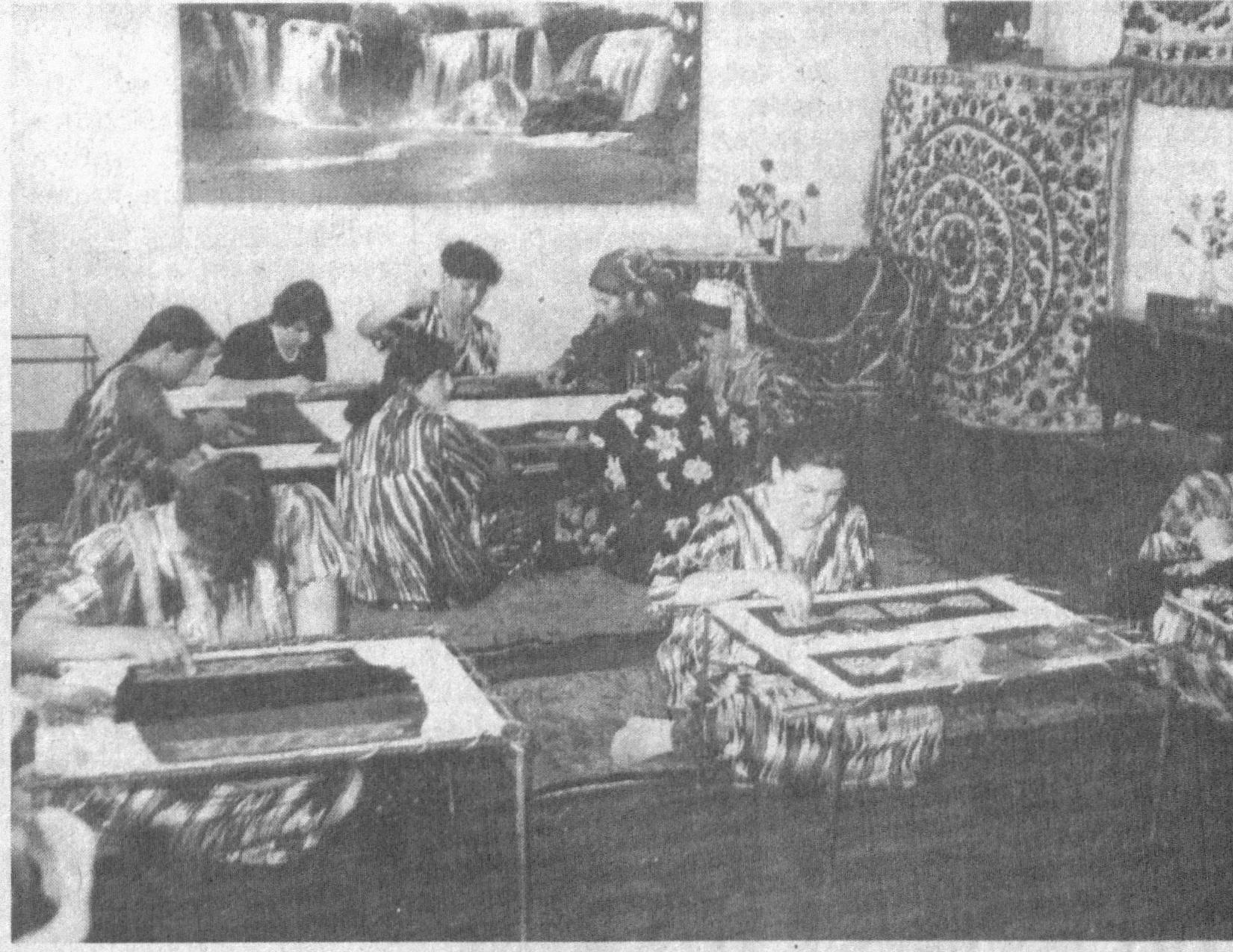
СУРАТЛАРДА: корхона фаолиятдан лавҳалар.