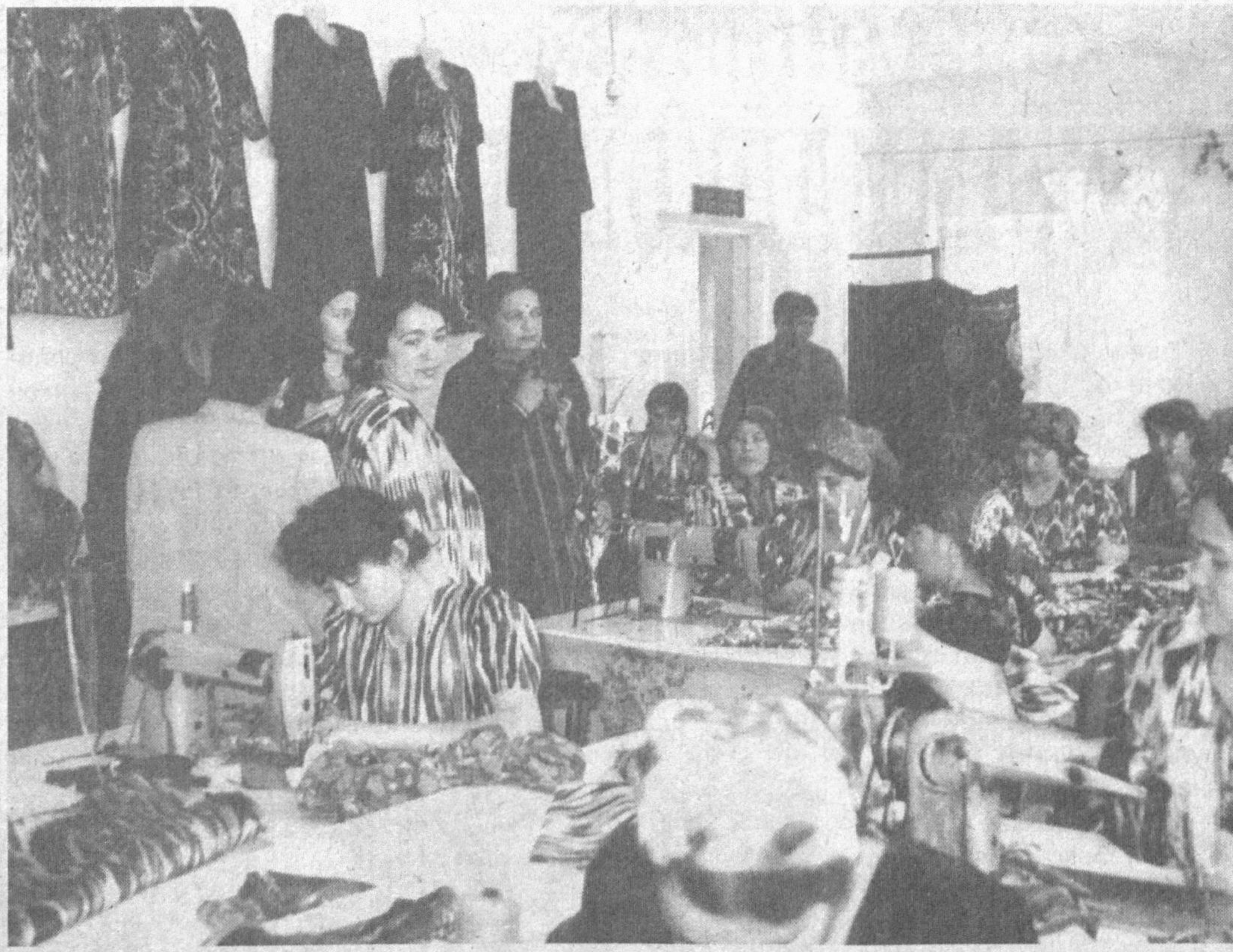
Денов туманида йил сайин тадбиркорлар сони ортиб бормоқда. Улар ўзлари ишлаб чиқараётган маҳсулотлари билан истеъмол бозорини тўлди-

Ҳар бир муносададаги қасаба уюшма қўмитасининг фаоллари қонунчиликка тўлиқ риоя қилинишини доимий назорат қилиб боришлари зарур.