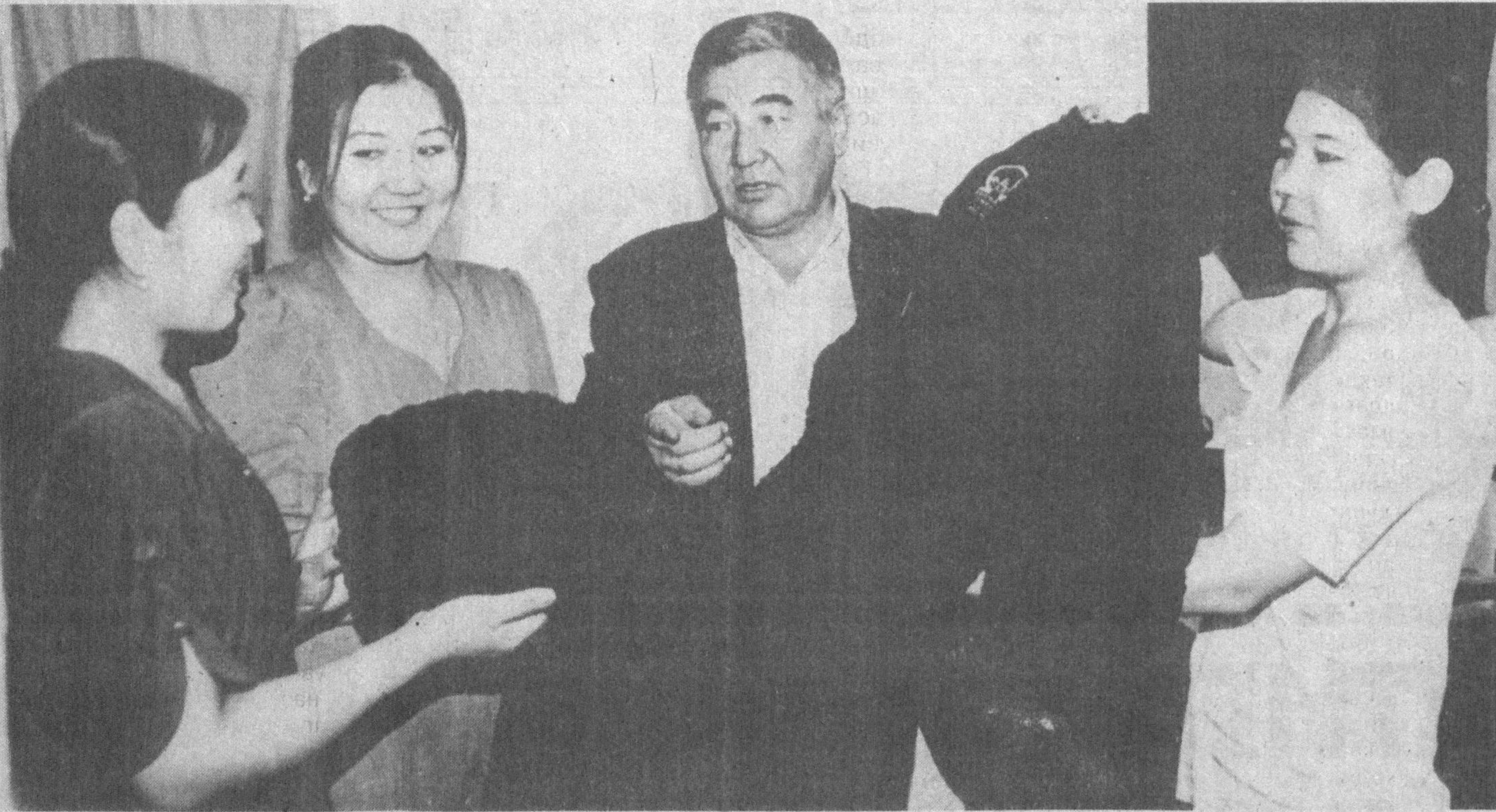
Конимех туманидаги «Конимех» ширкатлар ҳўжалиги наслчиликка ихтисослашган бўлиб, ишчи ўринларини кўпайтириш мақсадида терини қайта ишлаш ва тикувчилик цехлари ташкил этилди. Мазкур цехда 6 хилдаги кийим-кечалар тикилиб, миқозларга, етказиб берилмоқда.