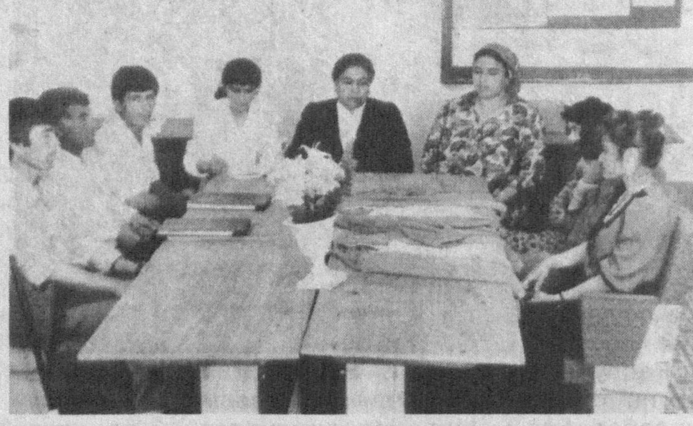
Ўқувчилар томонидан бошқарилади

ри ишлаб чиқарилмоқда. Лицей ҳисобидан шаҳарда «Гўзаллик саломи», нон ва нон маҳсулотлари