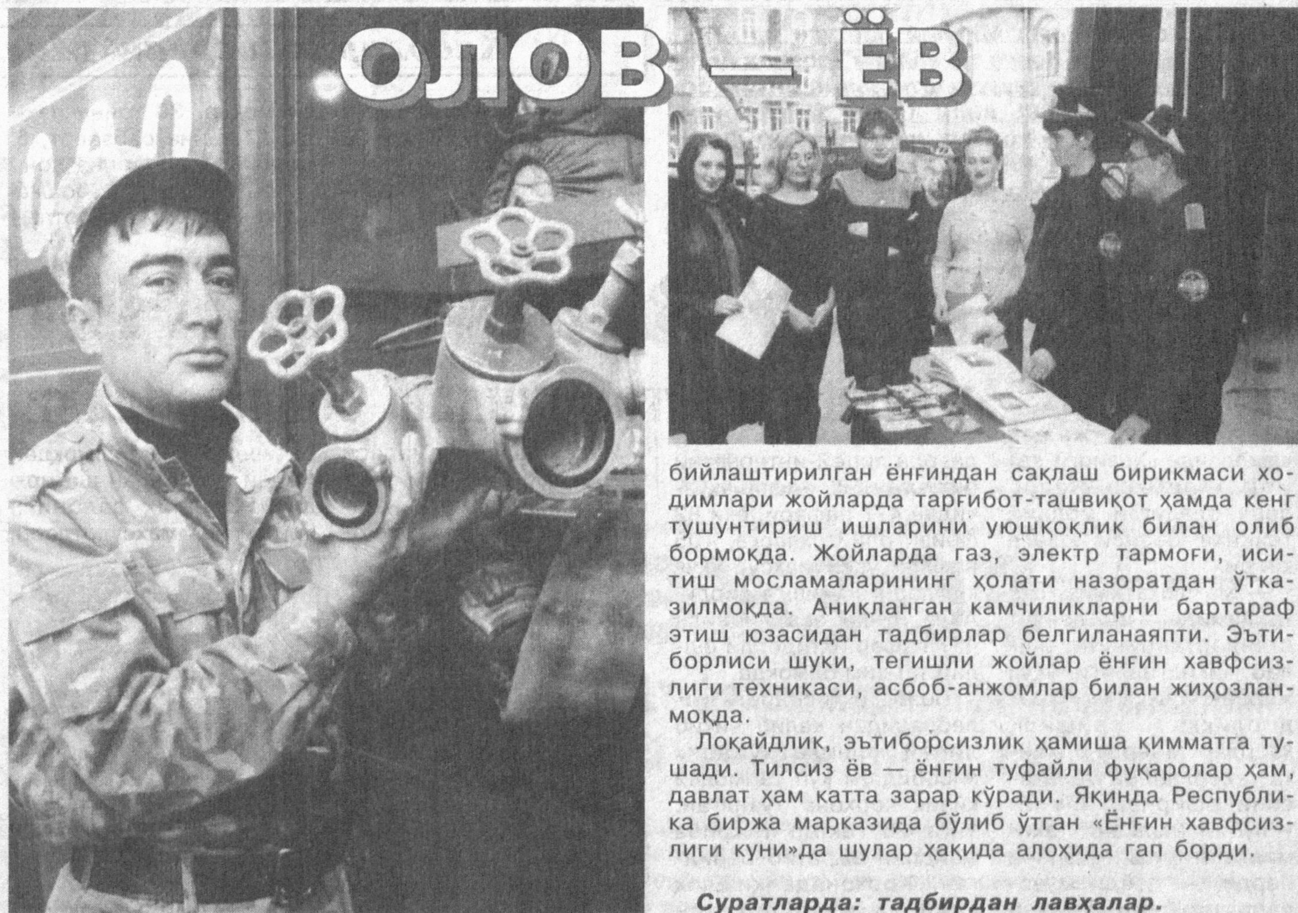
Республикада 15 ноябрдан 15 декабргача энгин хавфсизлиги ойлиги ўтказилмоқда. Шу муносабат билан Миробод туманидаги 3-сон хар-

2.Ўзбекистон Республикаси Вазирлар Маҳкамасининг 1996 йил 10 декабрдаги №437-қарорига биноан оилани ижтимоий-иқтисодий ҳимоя қилишни кучайтириш мақсадида жойларда оиланинг турар жойига қараб қишлоқ, овул ёки маҳалла фуқаролари йиғини қарорига асосан 16 ёшгача бўлган фарзандлари бор оилаларга нафақа тўланади. Бир фарзанди бўлган оилга энг минимал иш ҳақининг 50 фоизи, 2 та фарзанди бўлган оилга 100 фоиз миқдориди, 3 та фарзанди бўлган оилга 140 фоиз ҳамда 4 ва ундан кўпроқ бўлган фарзандларига 175 фоиз энг минимал иш ҳақи миқдориди тўланади. Бу маблағ республика маблағидан, маҳаллий бюджетдан, бюджетдан ташқари манбалардан берилиши мумкин.