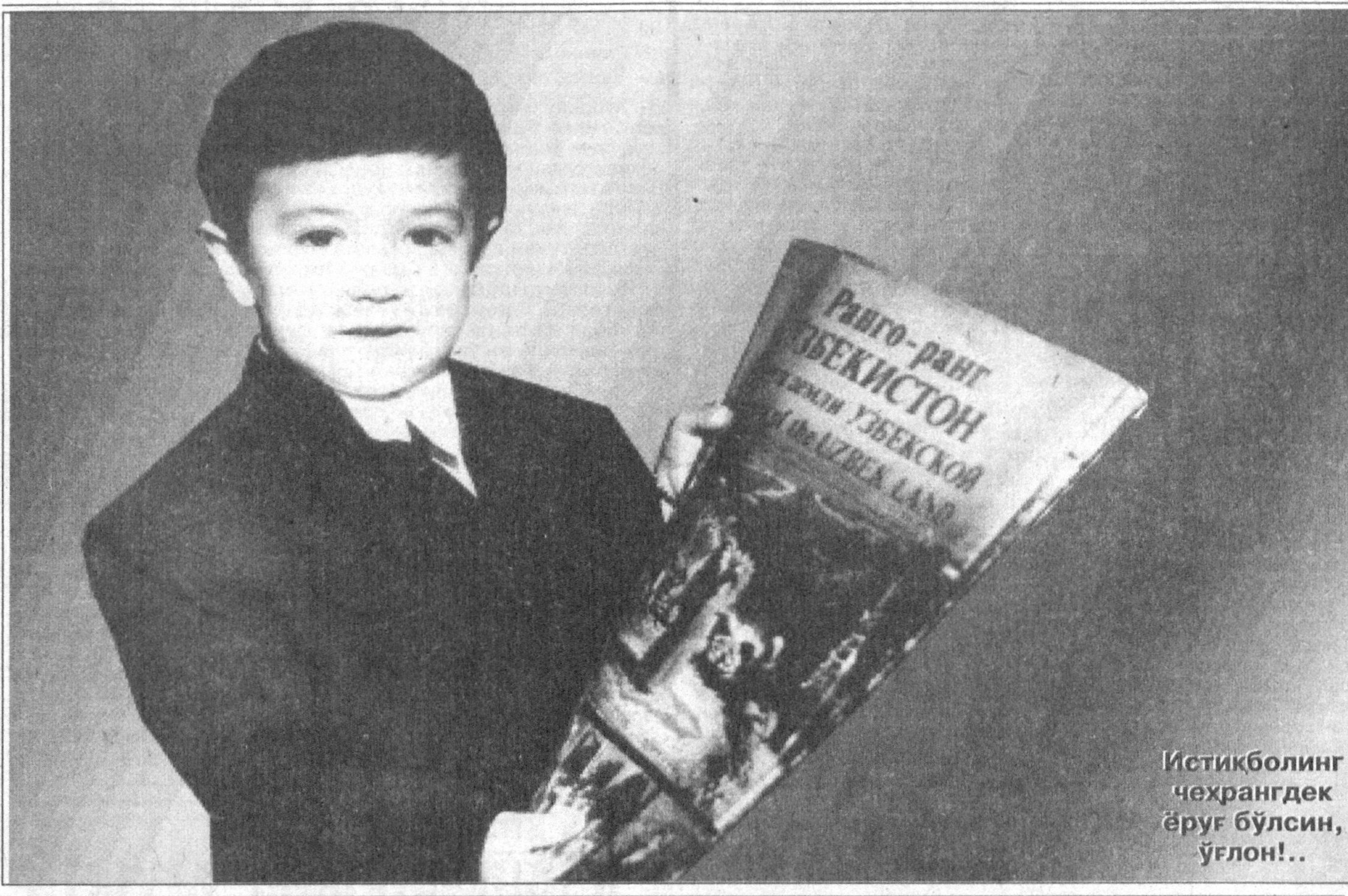
Истикболнинг чехрангдек ёруғ бўлсин, ўғлон!...