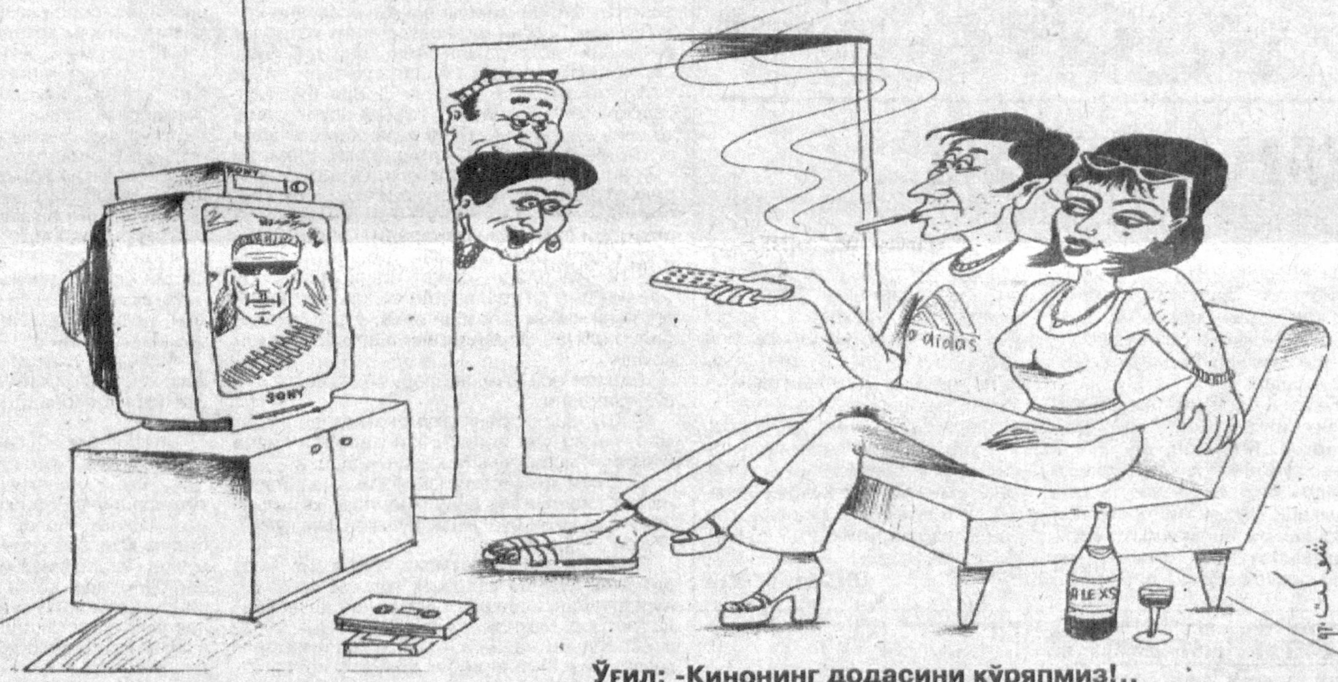
Ўғил: -Кинонинг додасини кўряпмиз!..

20-йилларнинг бошида ёзувчи Александр Неверов яратган "Тошкент — нон шаҳри" повестини эсланг. Ёзувчи Волга бўйлик бир дехқон оиласидаги очкинни шундай тасвирлайди: "Бобоси ўлди, бувиси ўлди, кейин отаси ўлди... Онаси очликдан касалга чалинди... эртаю кеч йиғлайди, очликнинг эса сира-сира раҳим келмай-