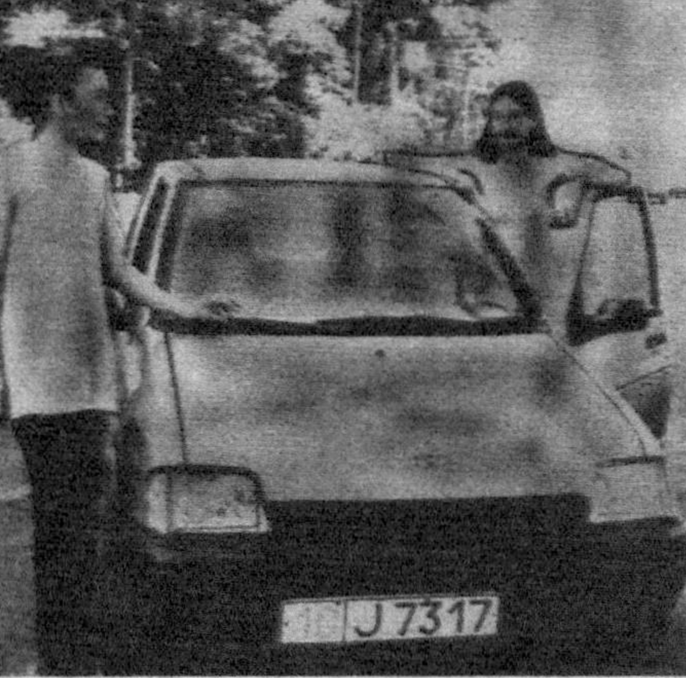
"Тико" минган санамлар, Хуснингиз ром этибди. Бир зум тўхтаб қаранглар: Баҳор ўтиб кетибди.

Хонада Майкл Жексон келгуси "Замин юлдузлари" фестивалига қатнашиш орзусида эмиш