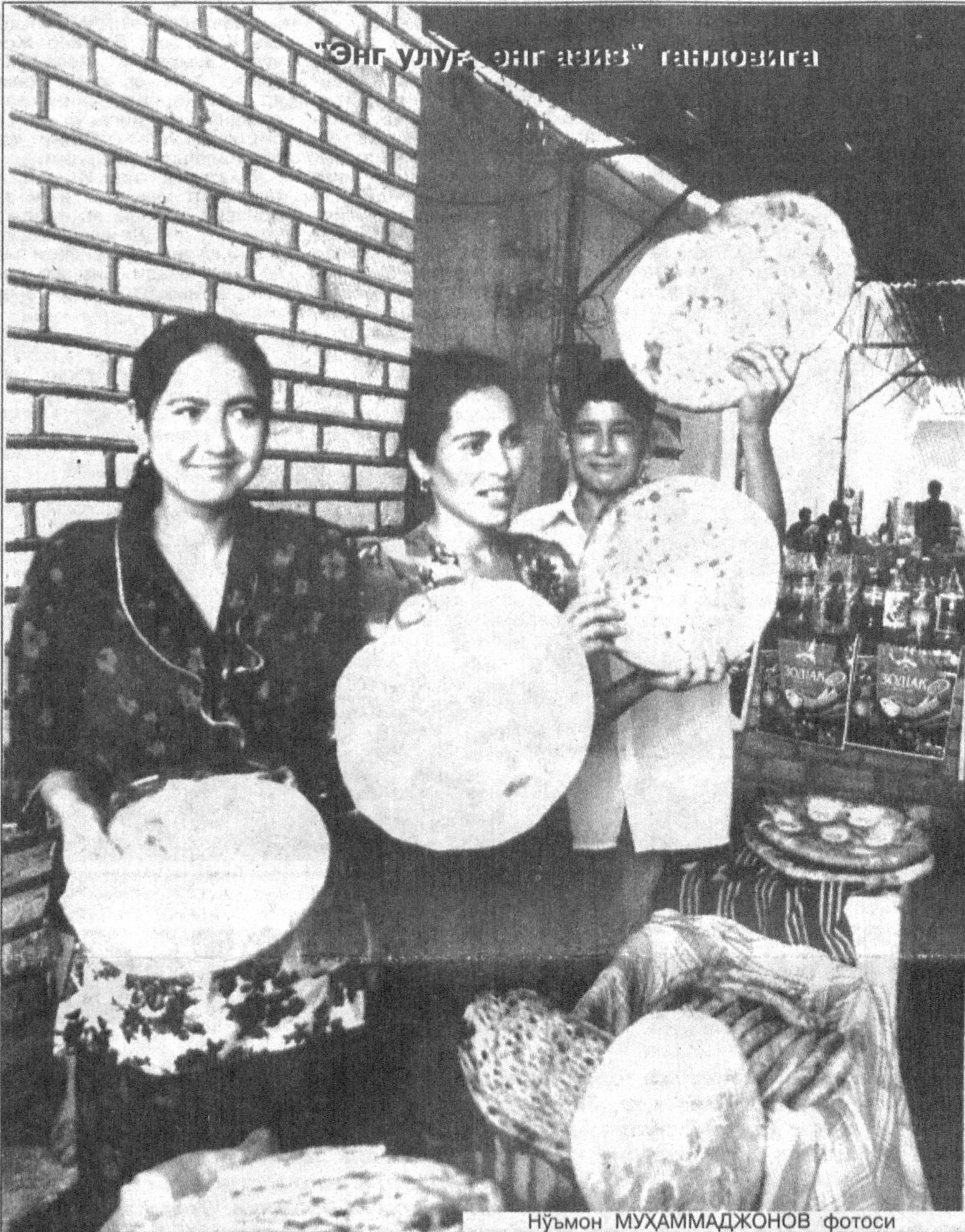
"Энг улуг, энг азиз" тағлиқовига