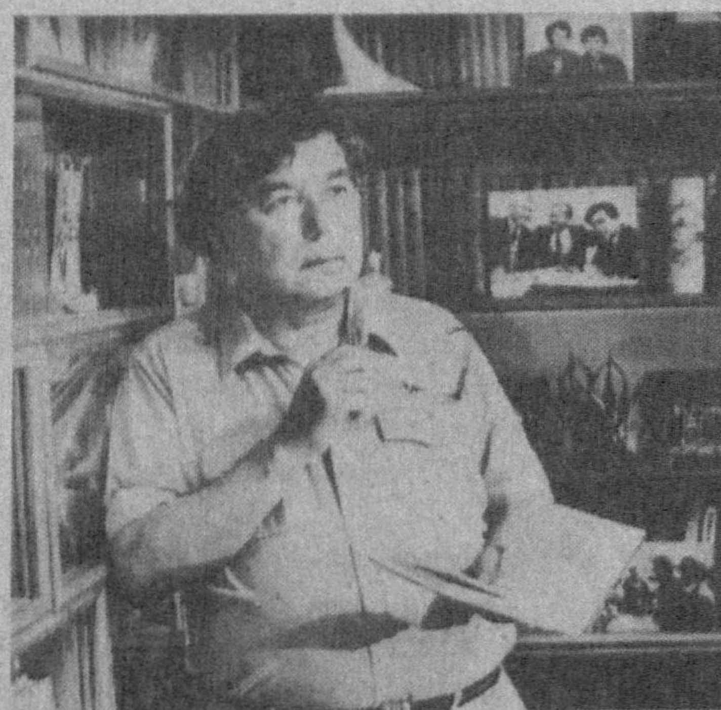
Рамз БОБОЖОН, Ўзбекистон халқ шоири