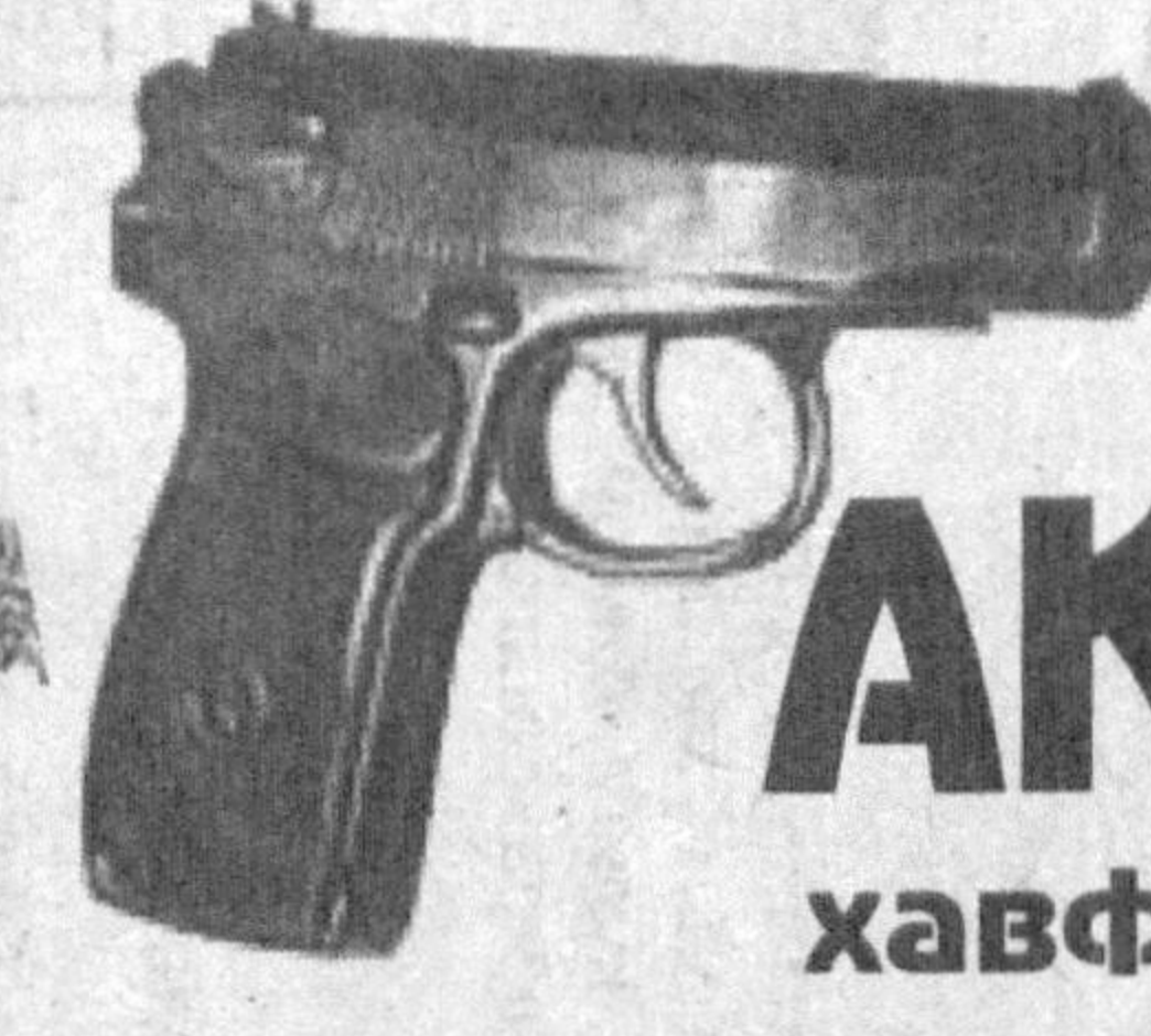
Унинг бор бисотини кўз-кўз қилиш оdatи қон-қонига сингиб кетган одамзод бугун ўзидagi мавжуд қурол-яроғ-