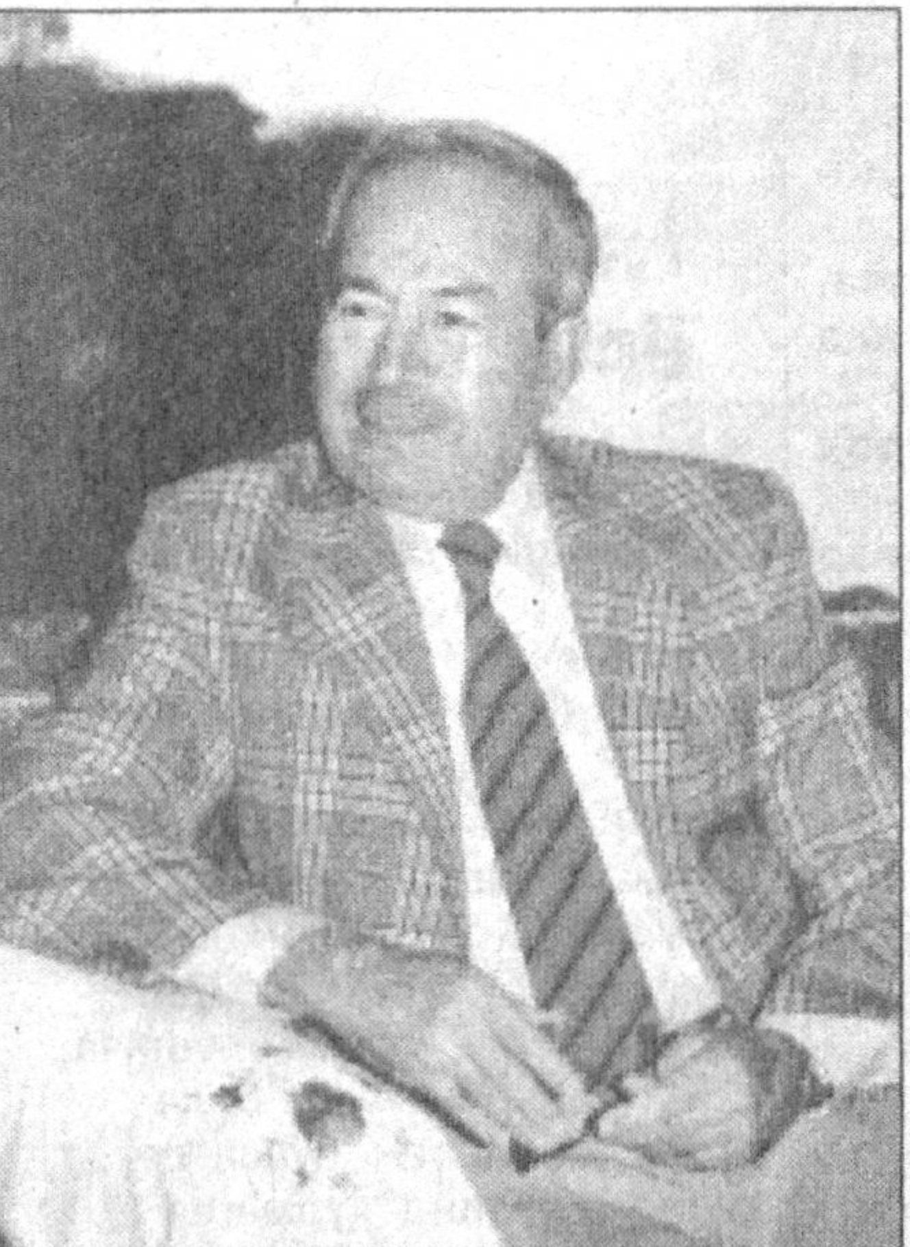
“Ўзбекистондаги ўзгаришлардан хайратдаман”, дейди Покистоннинг Ўзбекистондаги фавкулдда ва мухтор элчиси Фазал ҒАҒУР соҳиб

Хукумат мамлакат микёси-да соғлиқни сақлаш, вилоят-лар фаолиятини мувофиқла-тириш, халқро алоқа ва ҳам-корликларни йўлга қўйиш би-