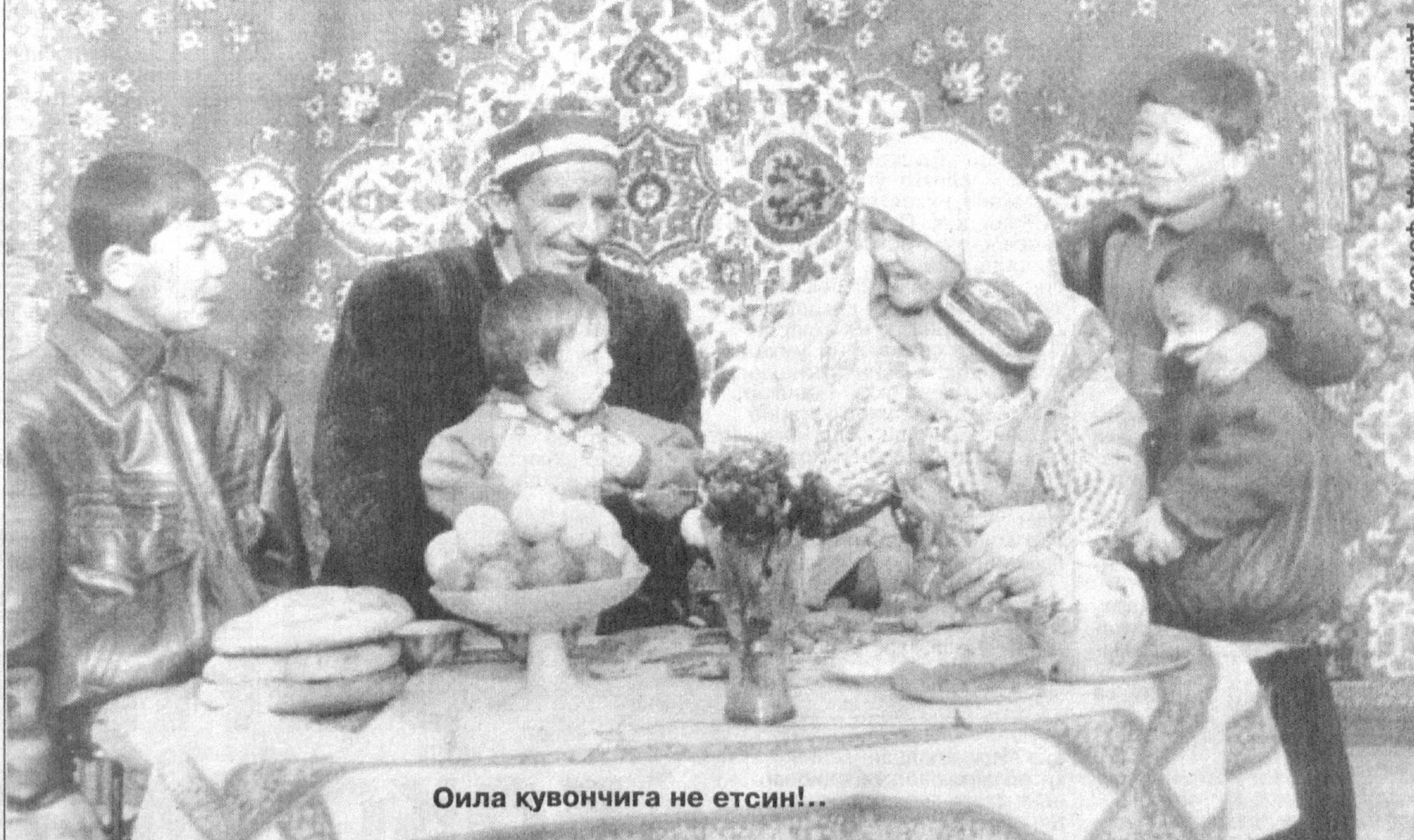
Оила қувончига не етсин!..

Инсоният тарихи йўл ва йўлсизликдан иборат. Чунки онгли инсон борки, ўзи учун, оиласи учун, жамоатчилик ва жамият учун йўл излайди. Йўл излашдан қўзланган бош мақсад мудоа аниқ: яхши яшаш, фаровон яшаш, узоқроқ яшаш, инсоний яшаш. Умумлаштириб айтганда, илохий китоблардан тортиб ахли донишлар яратиб қолдирган маънавий меросларнинг бари пировардида мана шу мақсадларга қаратилгандир. Яхши, фаровон, узоқ ва инсоний яшаш шунчалик мушкулми, деган савол туғилади. Не-не буюқ ва бетакрор ақл эгалари ҳаётини дасуруламал яратган бўлмасинлар, ҳар бир замон, ҳар бир янги давр, ижтимоий шарт-шароит одамлар олдида янги-янги муаммоларни кўндаланг қўяверади.