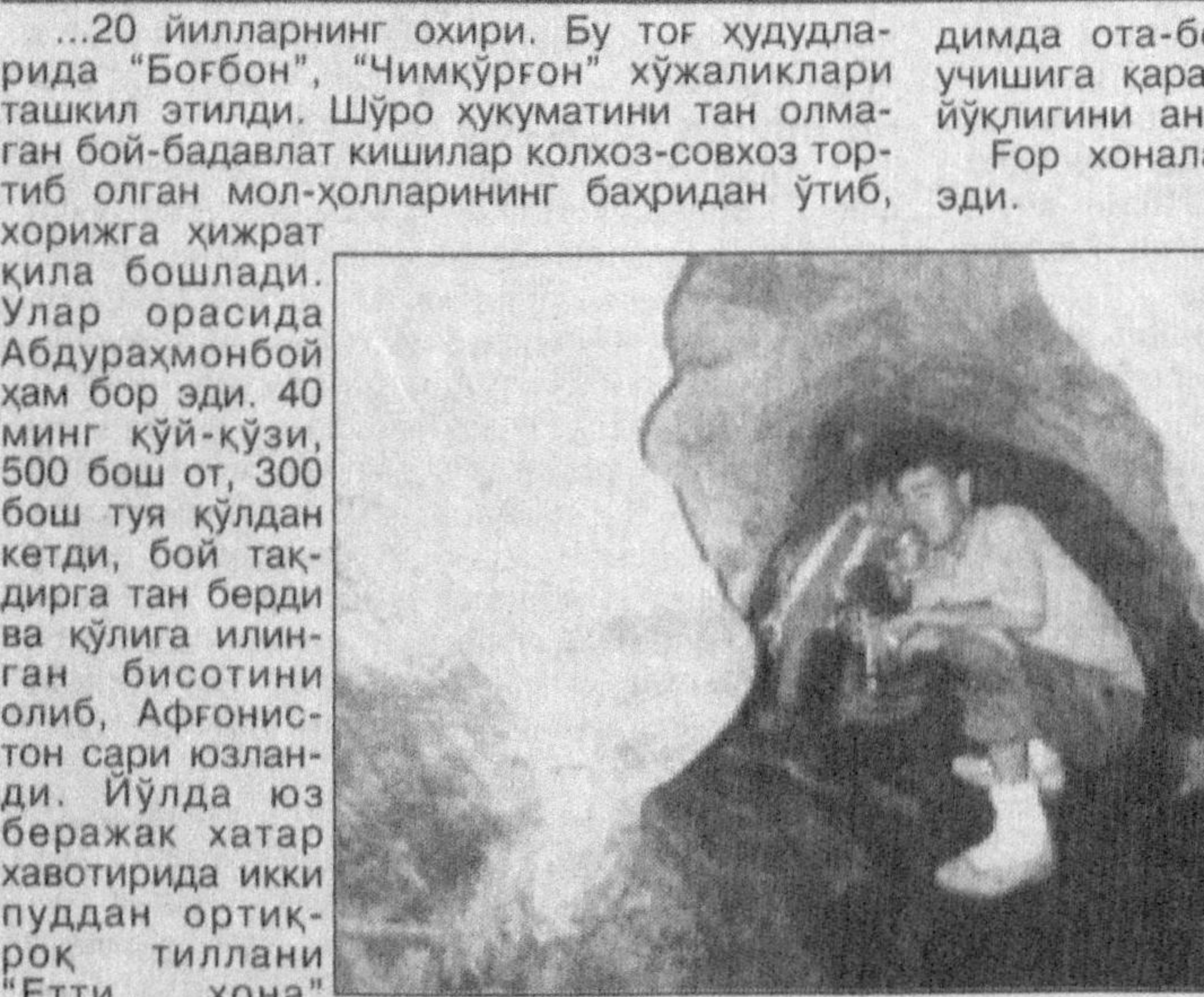
Фориш тумани худудидан ўтган Нурота тизма тоғларидаги Етимтоғ чўққисини Писталитоғ ҳам дейишади. “Етти хона” гори ўша ерда.