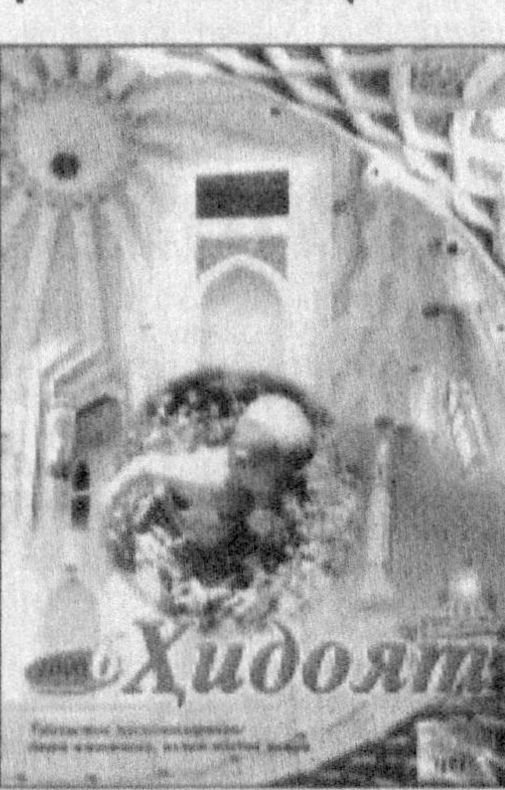
занд тарбияси, оналар саломатлигини тиклаш, гиёҳвандликка қарши кураш каби

Маълумки, юртимизда ёш авлоднинг ҳар томонлама баркамол қилиб тарбиялаш йўлида жуда қўнлаб тадбирлар амалга оширилмоқда. Журналдан ана шу тадбирлар ҳақидаги қизиқарли суҳбат ва учрашувларга ҳам ўрин берилган. Шунингдек, фар-