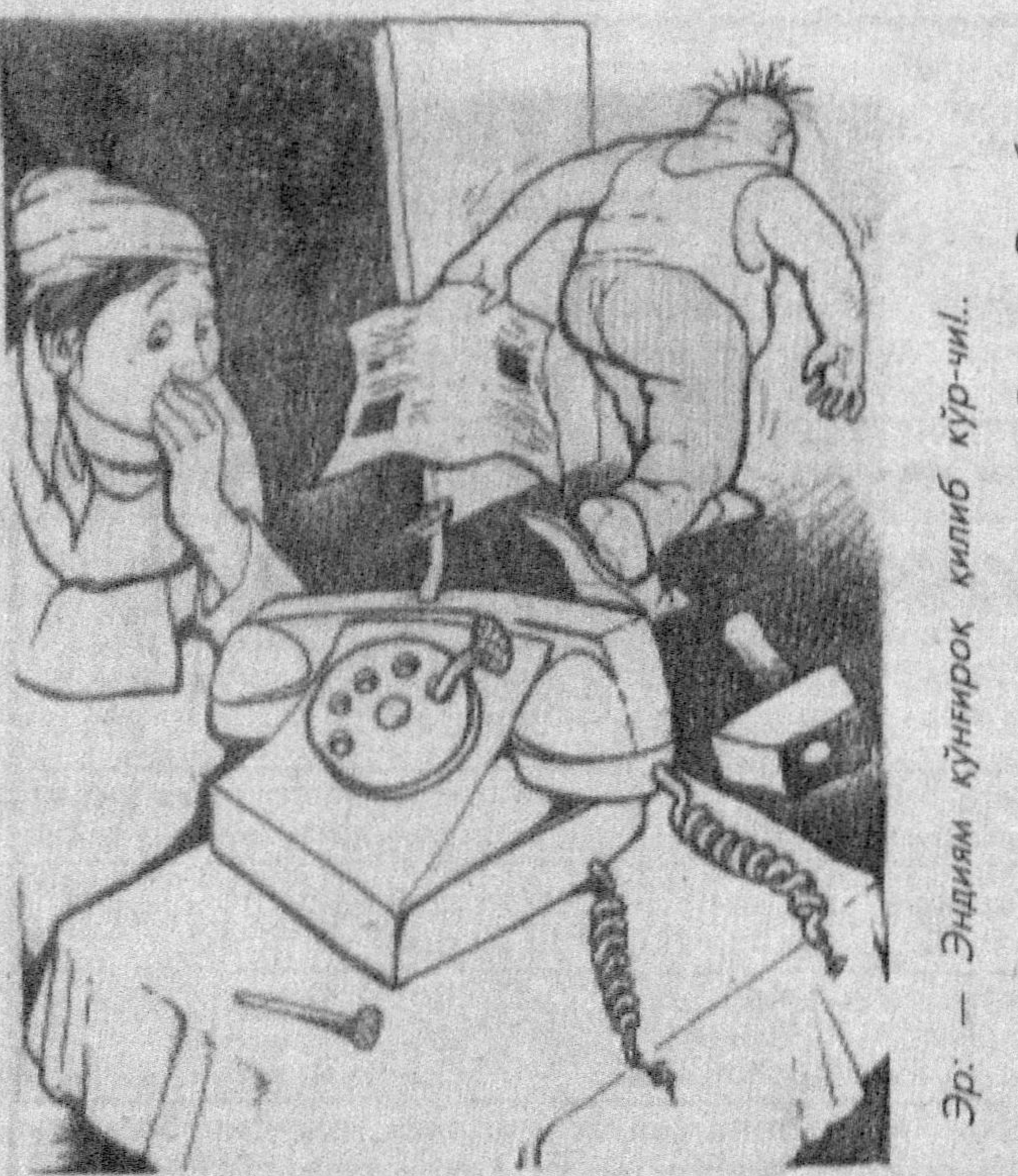
Эр. — Энцидим қўнғироқ қилиб кўр-чи. Россом — Ровшан Эюкоббердиев

Сақламаса кек қайси бир инсон, Унинг ҳаёти доимо ёнғустон. *** Бўлма асло сен ёнгилтат, Бир кун ёйсан ёмон калтақ. *** Ёшлик — довраяқлак фасли, Қарлик ҳиқматдир асли. *** Ғазаб — жоҳилликда, бойлик — аҳилликда. *** Қариганда ҳам қилсанг ҳаракат, Умрингға қўшилади — баракат. Нурмухаммад ҲАЙДАРОВ