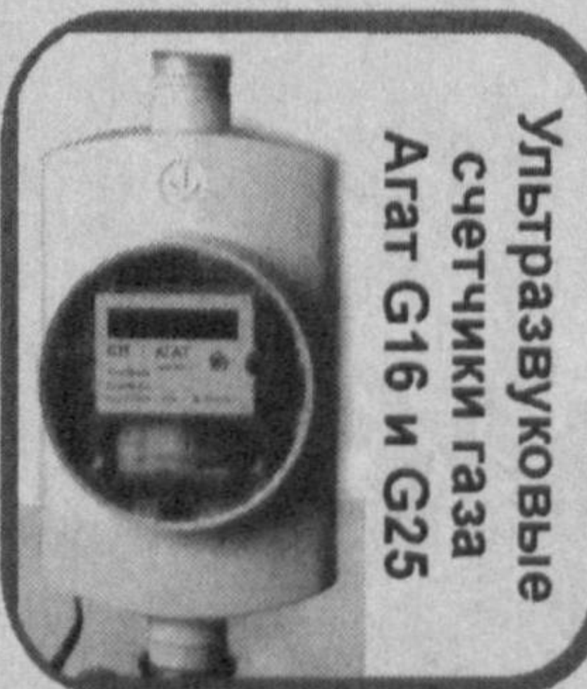
Ультразвуковые счетчики газа Агат G16 и G25

УЛЬТРАЗВУКОВЫЕ СЧЕТЧИКИ ГАЗА (МАРКИ «АГАТ») С ЭЛЕКТРОННОЙ КОРРЕКЦИЕЙ ИЗМЕРЯЕМОГО ГАЗА ПО ТЕМПЕРАТУРЕ,