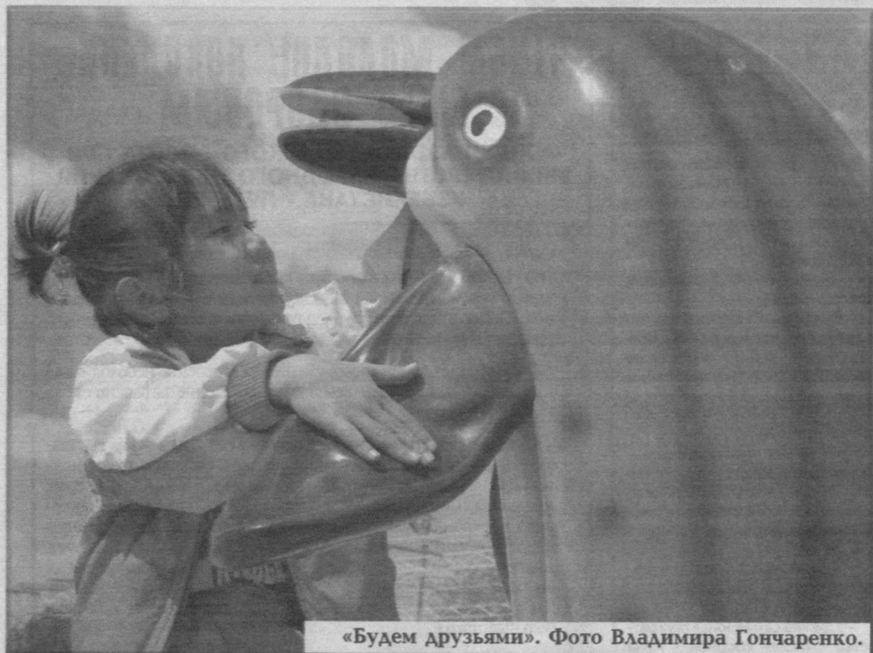
«Будем друзьями».