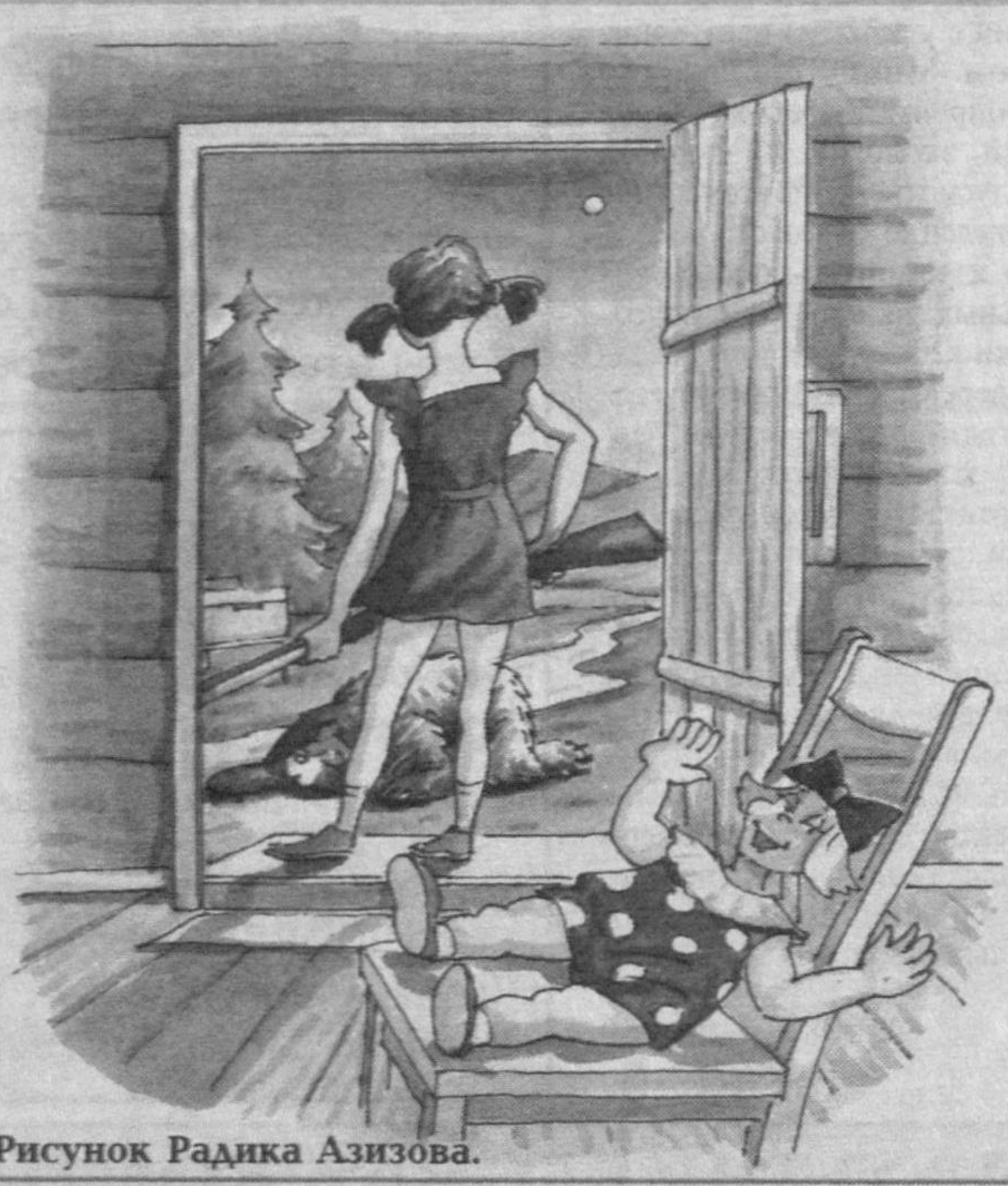
Рисунок Радика Азизова.

над крепко сколоченным столом. Звон кружек, малина - горстями, куски мяса, теплый хлеб и снова звон кружек.