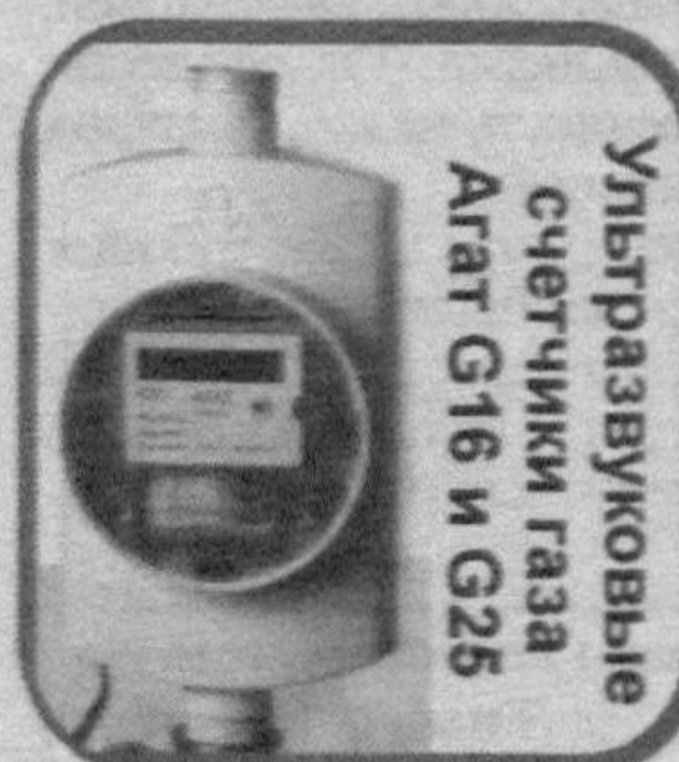
Ультразвуковые счетчики газа Агат G16 и G25

которые являются современными электронными приборами учета газа, произведенными в России.