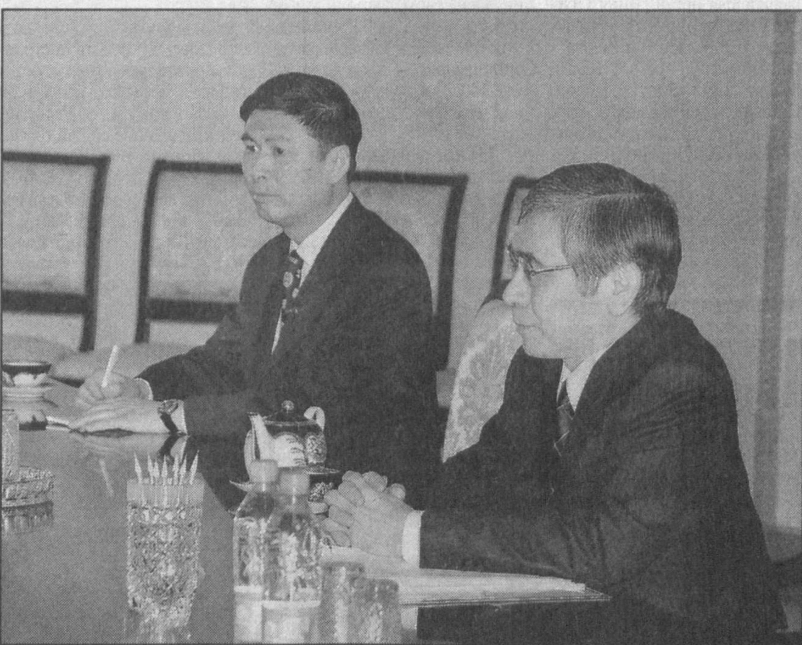
ПРЕЗИДЕНТ РЕСПУБЛИКИ УЗБЕКИСТАН ИСЛАМ КАРИМОВ 31 ОКТЯБРЯ В РЕЗИДЕНЦИИ ОКСАРОЙ ПРИНЯЛ ПРЕЗИДЕНТА АЗИАТСКОГО БАНКА РАЗВИТИЯ ХАРУХИКО КУРОДУ