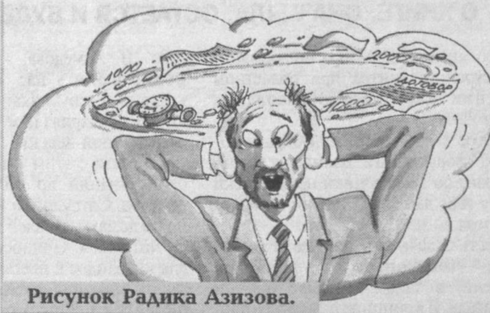
Рисунок Радика Азизова.

Теперь сделаем паузу, дабы особо обратить внимание на следующий факт. Ибо "...на основании этого документа в карточку абонента вносятся изменения, и в дальнейшем расчеты с потребителем за использованный природный газ осуществляются на основании показаний газового счетчика". Далее, в официальном ответе Ф.Бойжигитов подтверждает, что в случае с Субханкуловым