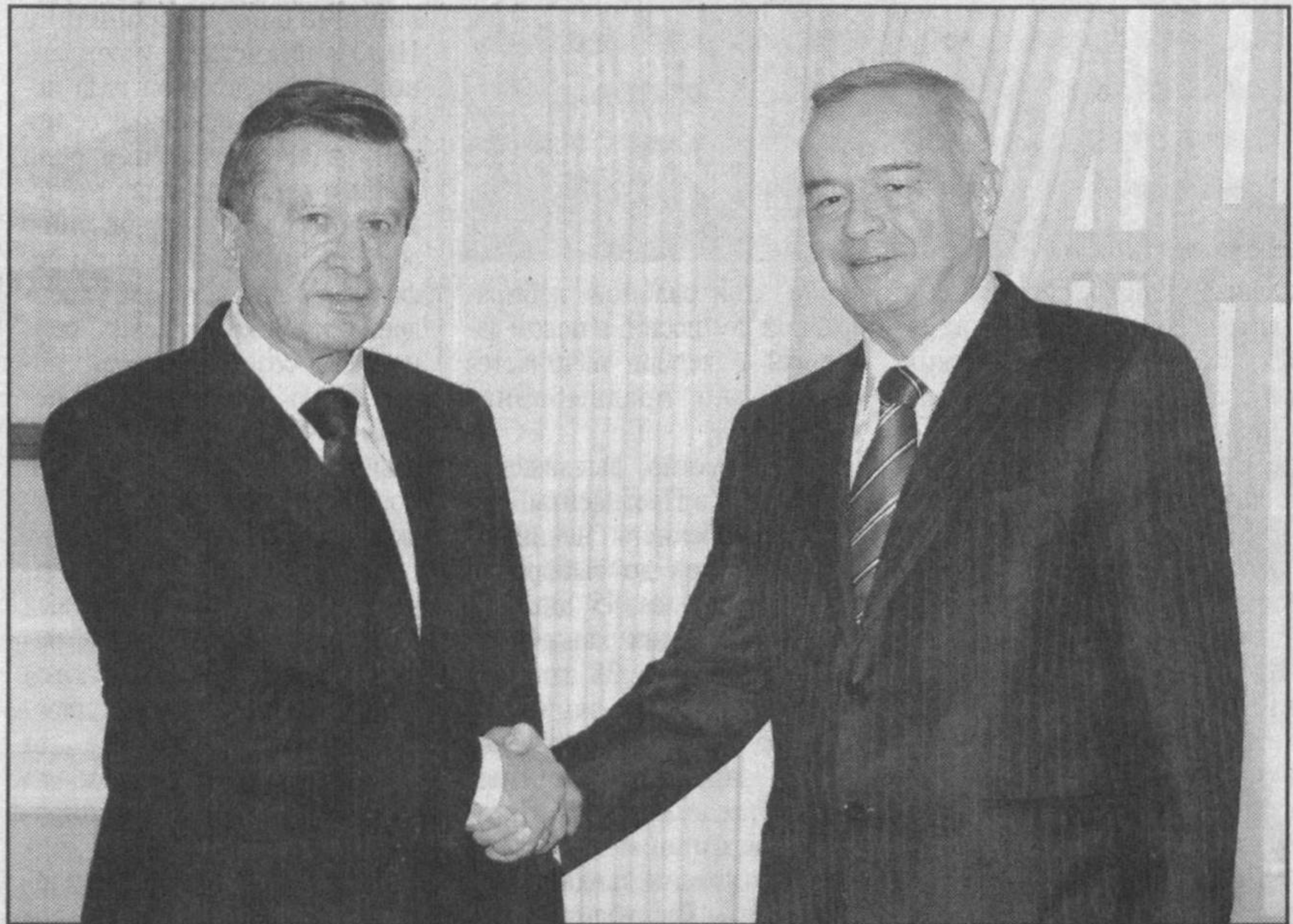
Президент Республики Узбекистан Ислам Каримов 2 ноября в резиденции Оксарой принял председателя правительства Российской Федерации Виктора Зубкова.

Глава нашего государства, приветствуя гостя, отметил, что сотрудничество между Узбекистаном и Россией всемерно развивается в духе Договора о союзнических отношениях, наши страны также эффективно взаимодействуют в рамках Шанхайской организации сотрудничества.