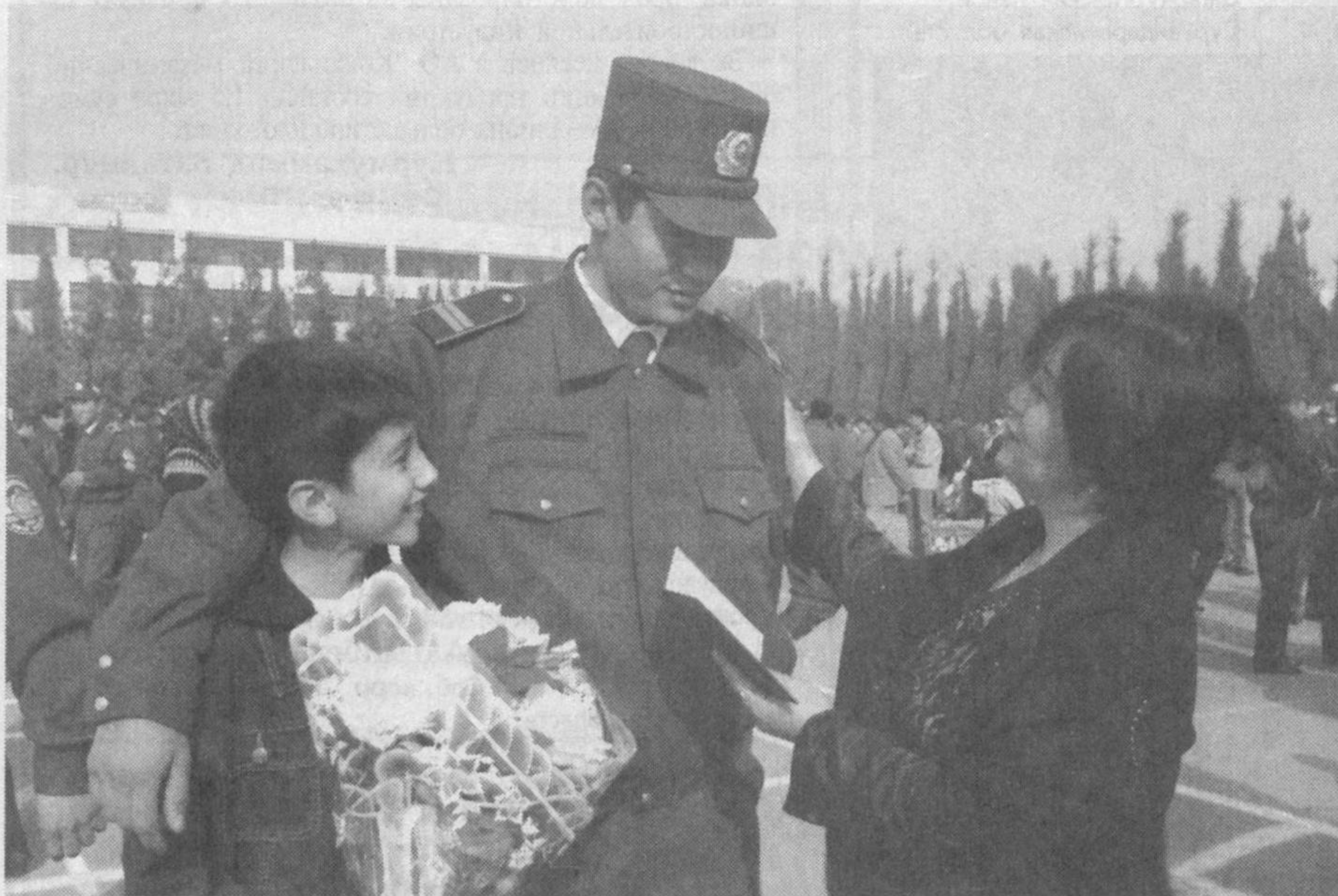
В нашей стране осуществляется широкомасштабная работа по дальнейшему совершенствованию системы подготовки кадров для органов внутренних дел.

Как отмечалось в праздничном поздравлении Президента Ислама Каримова сотрудниками органов внутренних дел, практически на каждом этапе формирования новой основы вертикальной