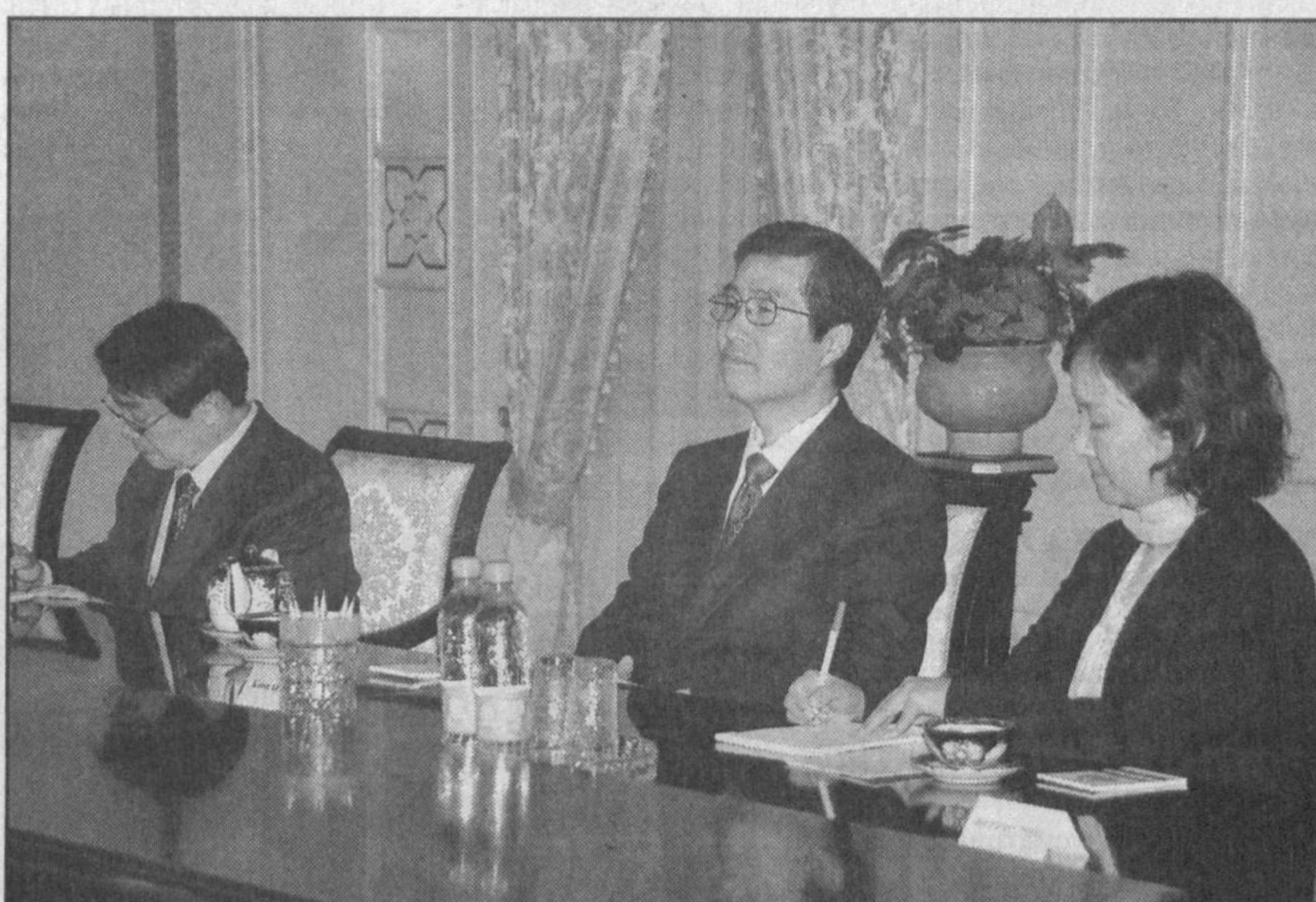
Президент Республики Узбекистан Ислам Каримов 12 декабря в резиденции Оксарой принял заместителя Премьер-министра, министра финансов и экономики Республики Корея Квон О Кю.