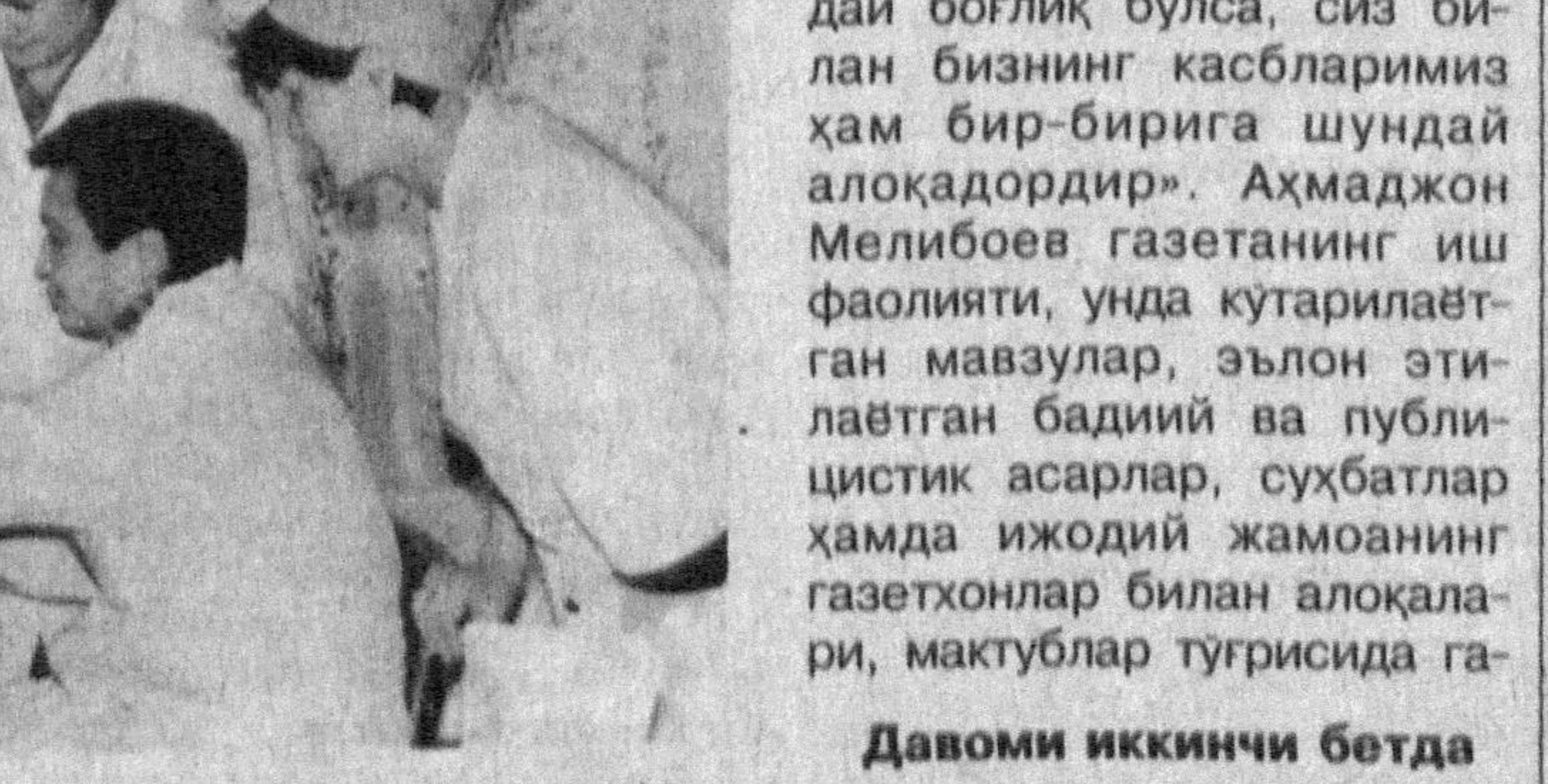
Давоми иккинчи бетда

«арафа» деб атайдиган бўлсак, Навруз арафаси кунлари Тошкент давлат 2-тиббевит институтининг 2-шифохонаси шифокорлари фаолиятида узига хос мазмун касб этди. Шифокорларнинг «Ўзбекистон адабиёти ва санъати» газетаси ижодий жамоаси билан Наврузга бағишлаб ўтказган учрашувида бунга ишончи ҳосил қилдик.