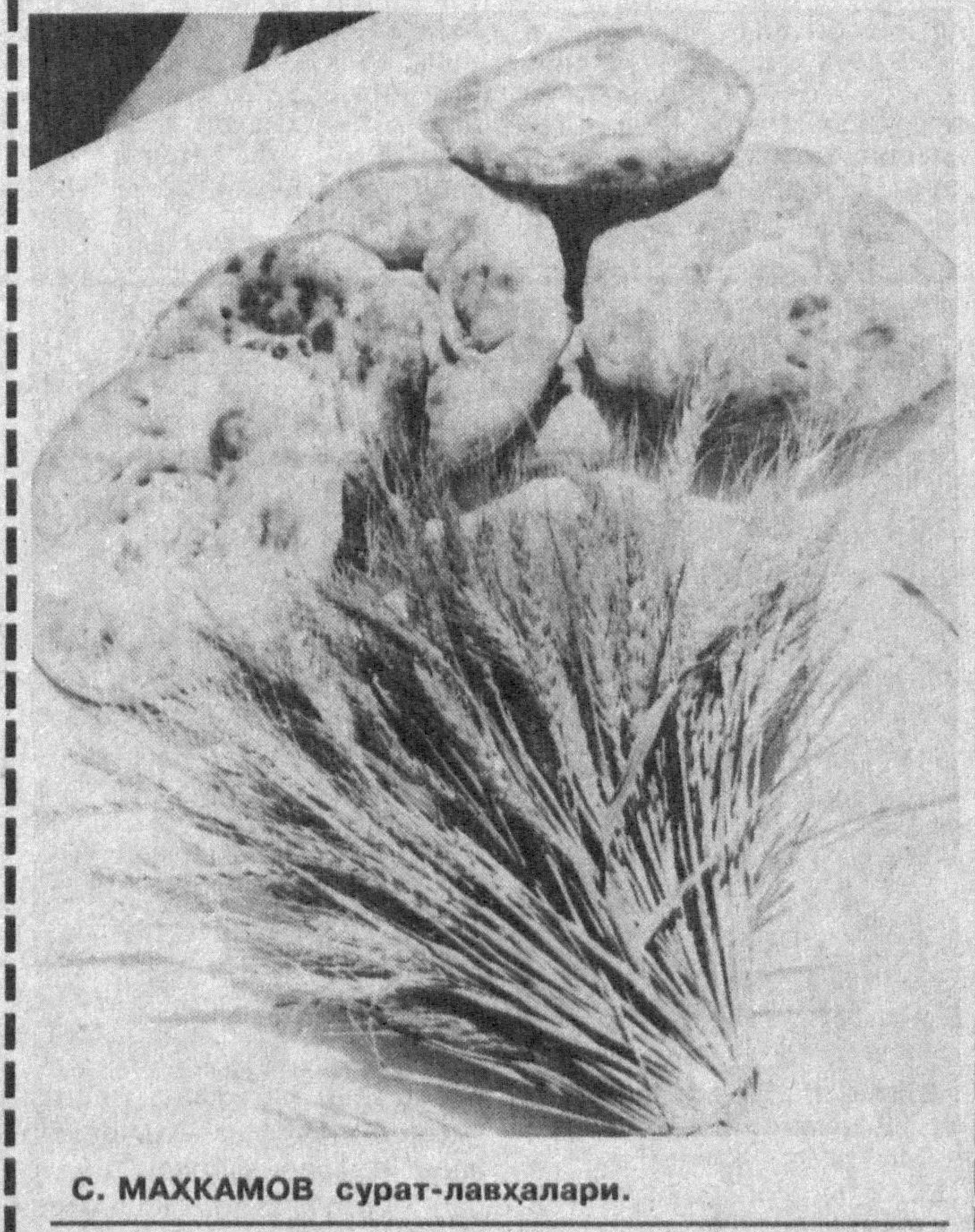
С. МАҲКАМОВ сурат-лавҳалари.