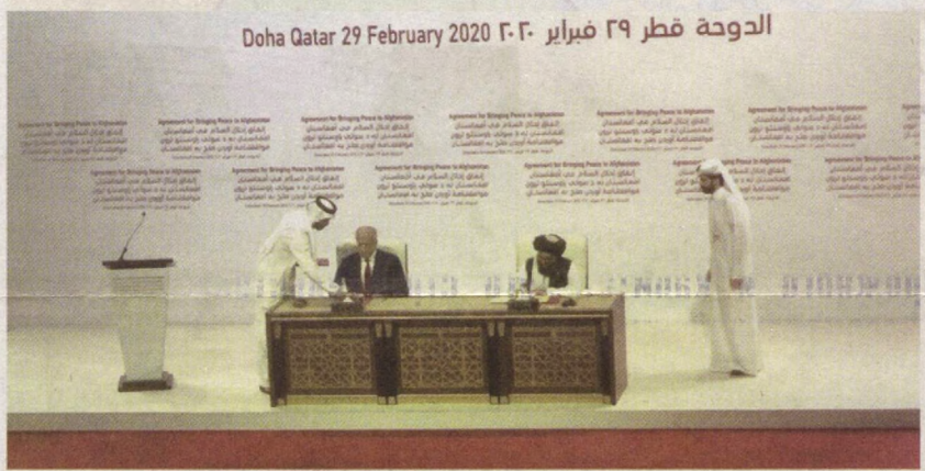
Doha Qatar 29 February 2020 دوحه قطر ٢٩ فبراير ٢٠٢٠

Благие инициативы Президента Шавката Мирзиёева вселяют надежду на мир и спокойствие в Центральной Азии