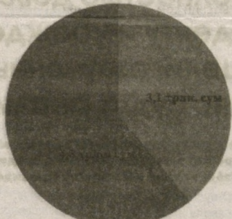
Источники ипотечных кредитов, выделенных коммерческими банками

■ Ресурсы коммерческих банков ■ Централизованные ресурсы