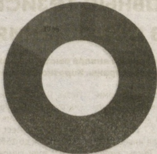
Классификация выделенных кредитов со стороны коммерческих банков по процентной ставке (в млрд. сум.)

■ В рамках ставки рефинансирования ■ По рыночной процентной ставке