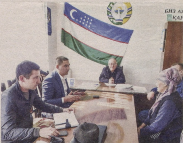
ООО «Nurizam servis», г. Алмалык

ПОЗДРАВЛЯЕТ УЗБЕКИСТАНЦЕВ С ВЕСЕННИМ ПРАЗДНИКОМ НАВРУЗ! ПУСТЬ С НИМ В ВАШУ ЖИЗНЬ ПРИВНЕСЕТСЯ СВЕТЛОЕ, ВЕСЕННЕЕ НАСТРОЕНИЕ!