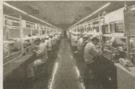
которые позволят смягчить последствия эпидемии коронавирусной инфекции для экономики страны, заявил еще один сотрудник NDRC Ли Хунь.

Правительство КНР планирует принять ряд мер,