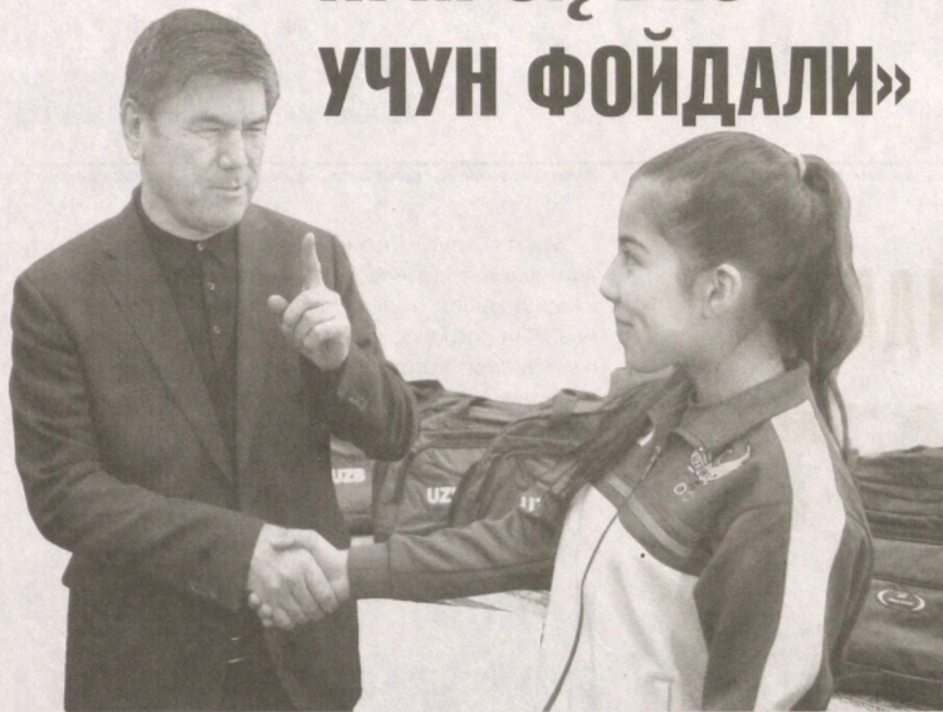
«Сен, албатта, Олимпиада чемпиони бўлишинг керак!»

Бу ўринда иккита жиҳат кишини ўйлантиради. Аввало, ер ажратиш тартиб-таомиллари электрон савдо орқали амалга оширилганидан тизим жорий этилгани ҳам анча бўлди. Иккинчидан, биз ҳар бир қадамимизда, учрашувларимизда китобхон ёшларни, китоб тарғиботига камарбаста йиғит-қизларни излаймиз. Бу хайрли ташаббусни қўллаб-қувватлаш учун ишни нимадан бошлаш ҳақида тушунтириш беришинг ўзи кифоя.