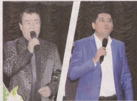
(Давоми. Бошланиши 1-саҳифада)

Аллома АЗИЗОВА, / Тошкент ҳақиқати / Аброр ЭСОНОВ олган суратлар