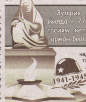
Зулфия Зокирова 1960 йилда - 77 ёшида “Бирортасиям келмади-я”, деган армон билан кўз юмган.