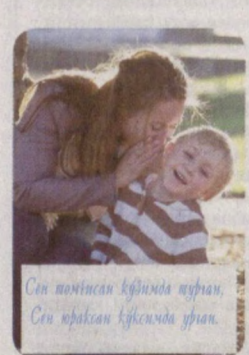
Сен шундан қўлингга нафис, Сен шундан қўлингга нафис.

Боланинг қизиқишларини ҳисобга олмай, уни турли репутаторларда мажбурлаб ўқитиш самарали натижа бермайди.