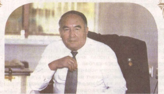
Эркин ВОҲИДОВ, Ўзбекистон Халқ шоири