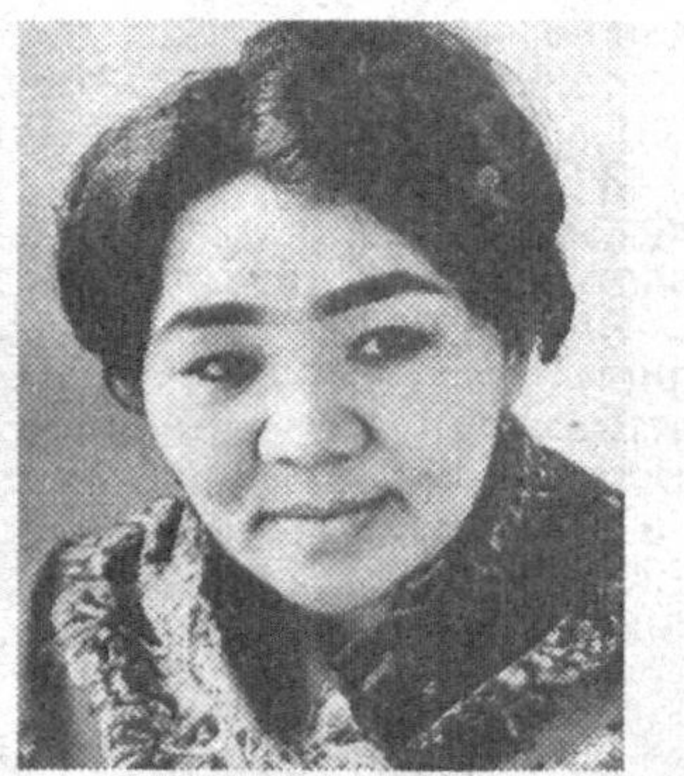
Халима ХУДОЙБЕРДИЕВА, Ўзбекистон халқ шоири

Бир қун... қабрда ётсанг ҳамки поймолсан У чақирса... Зумда тилканоолсанг Ерсан, аммо учиб, қўқанаолсанг Шунда, шунда Сен Ватанга арзийсан.