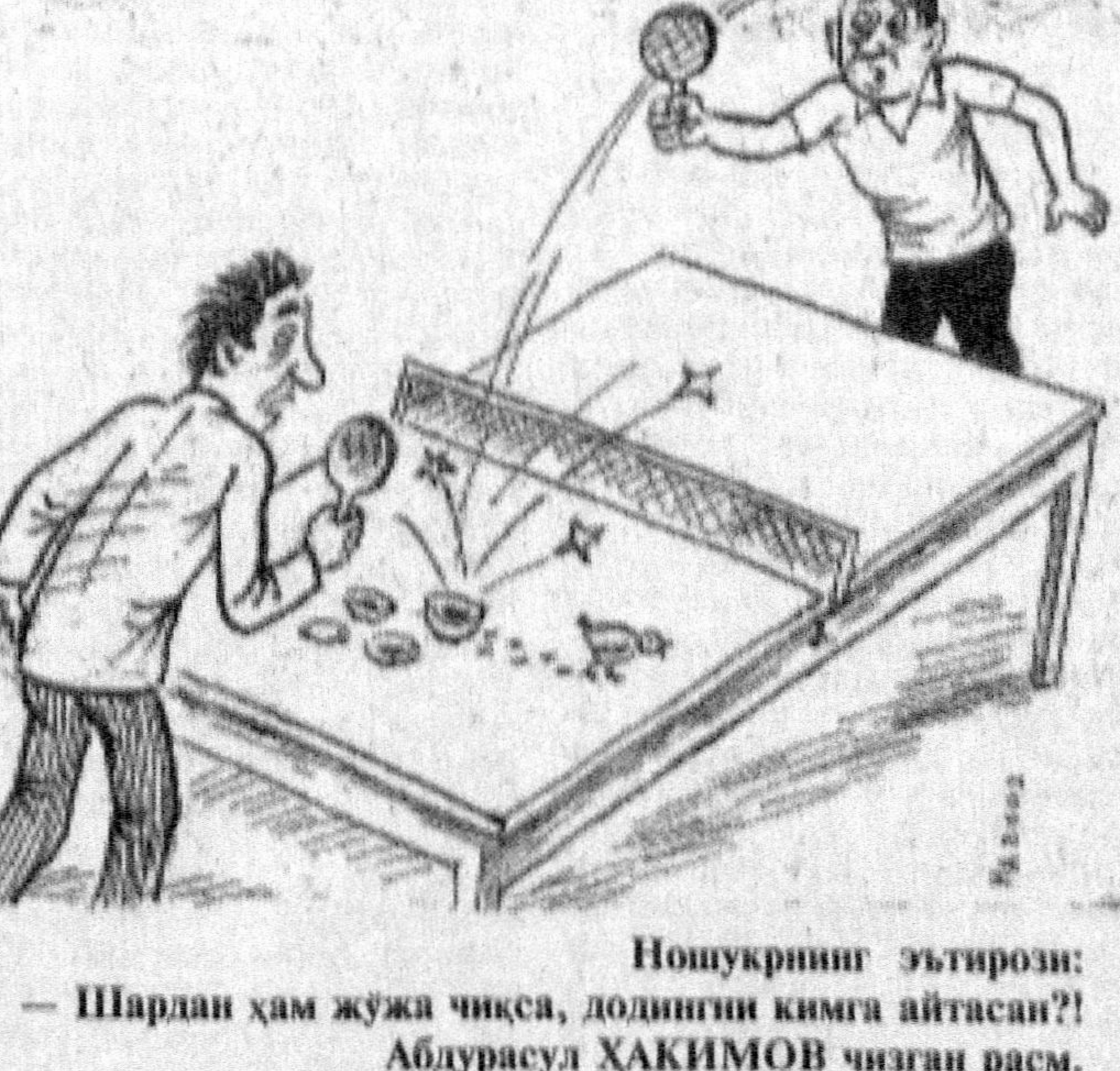
Ношўқрининг эътирозини: — Шардан ҳам жуға қисса, долдинги қимга айтасан! Абдурасул ҲАКИМОВ чизган расм.

Эслатиб ўтамиз: биринчи бўлиб тўғри жавоб йўллаган "Хуррият" муштарийинини "Хуррият"нинг қамтарона соғвағиси қутмоқда.