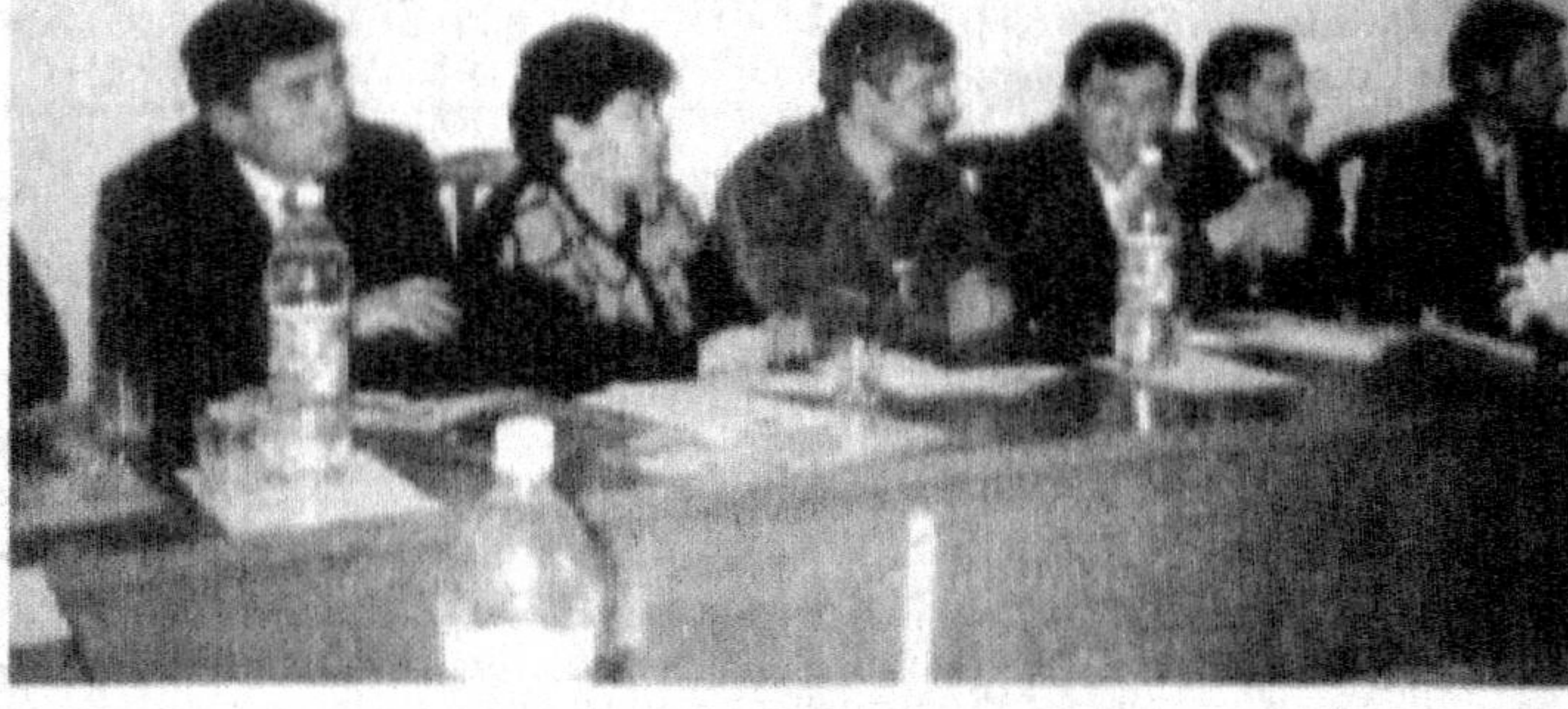
Қўшма маълумотларни тақислаш ва тақислаш бўлиб ўтди. Ушбу масалага бағишланган семинар-тренинг ўтган ҳафта Журналистларни қайта тайёрлаш марказида бўлиб ўтди...

1 декабрь Жаҳон ОИТСга қарши кураш кунин