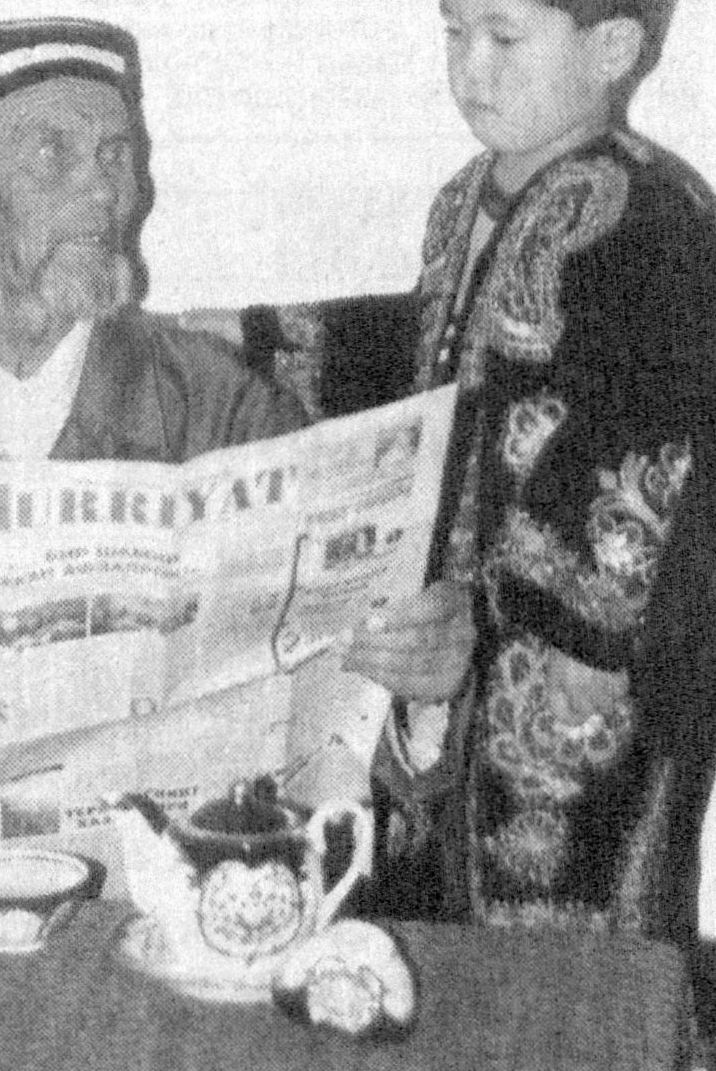
— Бобо, «Hurriyat»да яна нима чиқибди?

Кўриб турганимиздек давлат, жамият ва фуқаролар ўртасидаги ўзаро муносабатлар қайси даврда ва қайси давлатда бўлмасин, ўша замон файласуф олимларининг доимий равишдаги қизгин мунозараларига сабаб бўлиб келган. Қадимда яшаб ижод этган халқимизнинг буюк мутафаккирлари Абу Райҳон Беруний, Алишёр Навоий, Абу Наср ал-Фаробий ва бошқа катор олим-филсофлар уларнинг асарларида одил жамият барпо этиш ва адолатли ҳуқуқдор қандай фазилатларга эга бўлмоғи керак деган саволларга жавоб излаган ва бу ҳақдаги фикр-мулоҳазаларини ўз асарларида ёзиб қолдиришган.