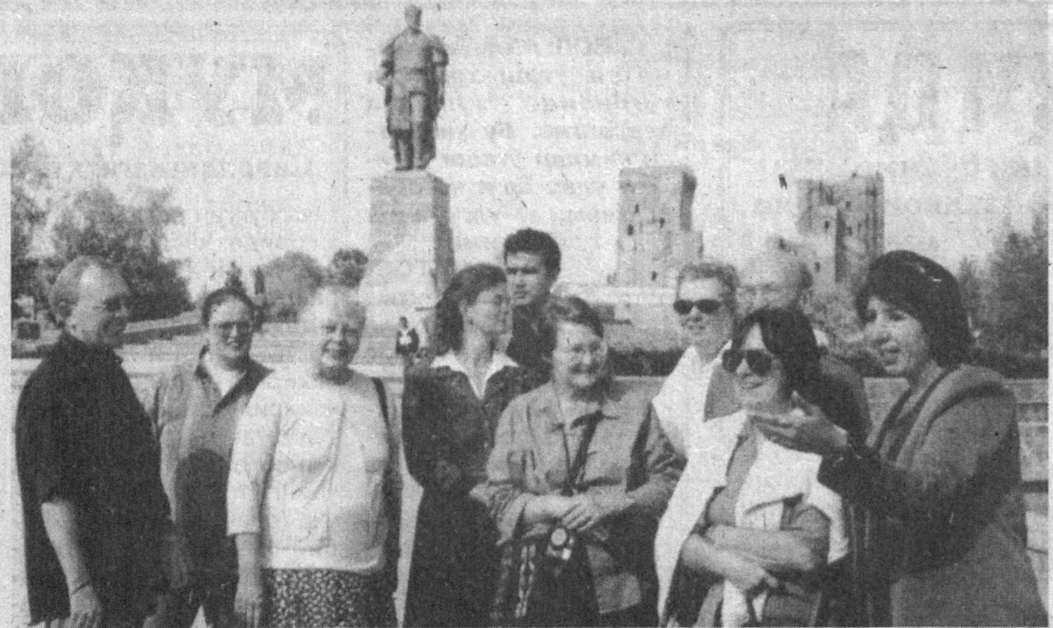
Кўхна Шаҳрисабзнинг халқаро ЮНЕСКО ташкилотининг тарихий шаҳарлари рўйхатида киритилганлиги бе-сайёҳлари ўзига мафтун этмоқда.

Дори-дармонлар ҳосил қилиш ва уларни саноят асосида ишлаб чиқаришни йўлга қўйишда Ўзбекистон Фанлар академиясининг Биоорганик кимё институтига бой тақриб-таўпланган. Фаолиятнинг бу йўналиши самарадорлигига эришиш мақсадида илмий муассаса ўзининг қўшма корхонасига ҳам эга бўлди.