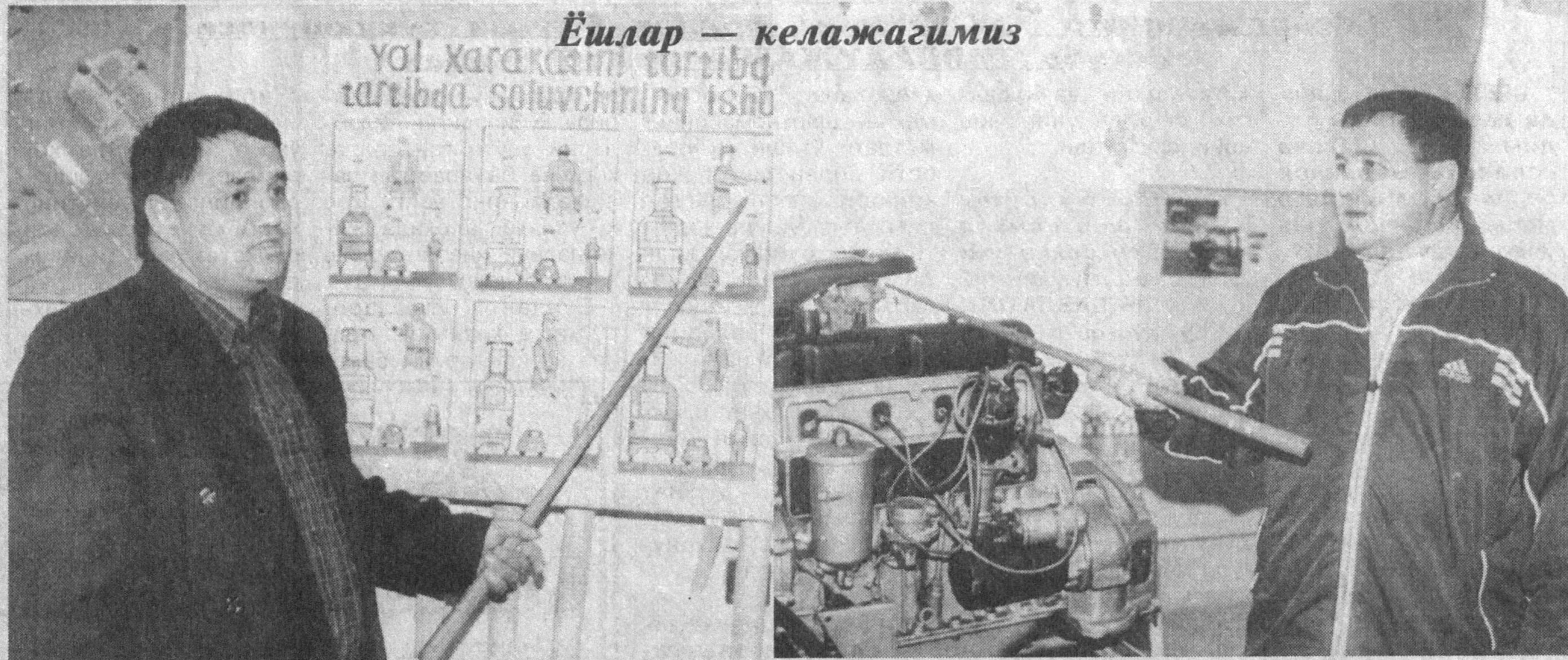
Ёшлар — келажакимиз

Yol harakatini tartibga soluvchining ishi