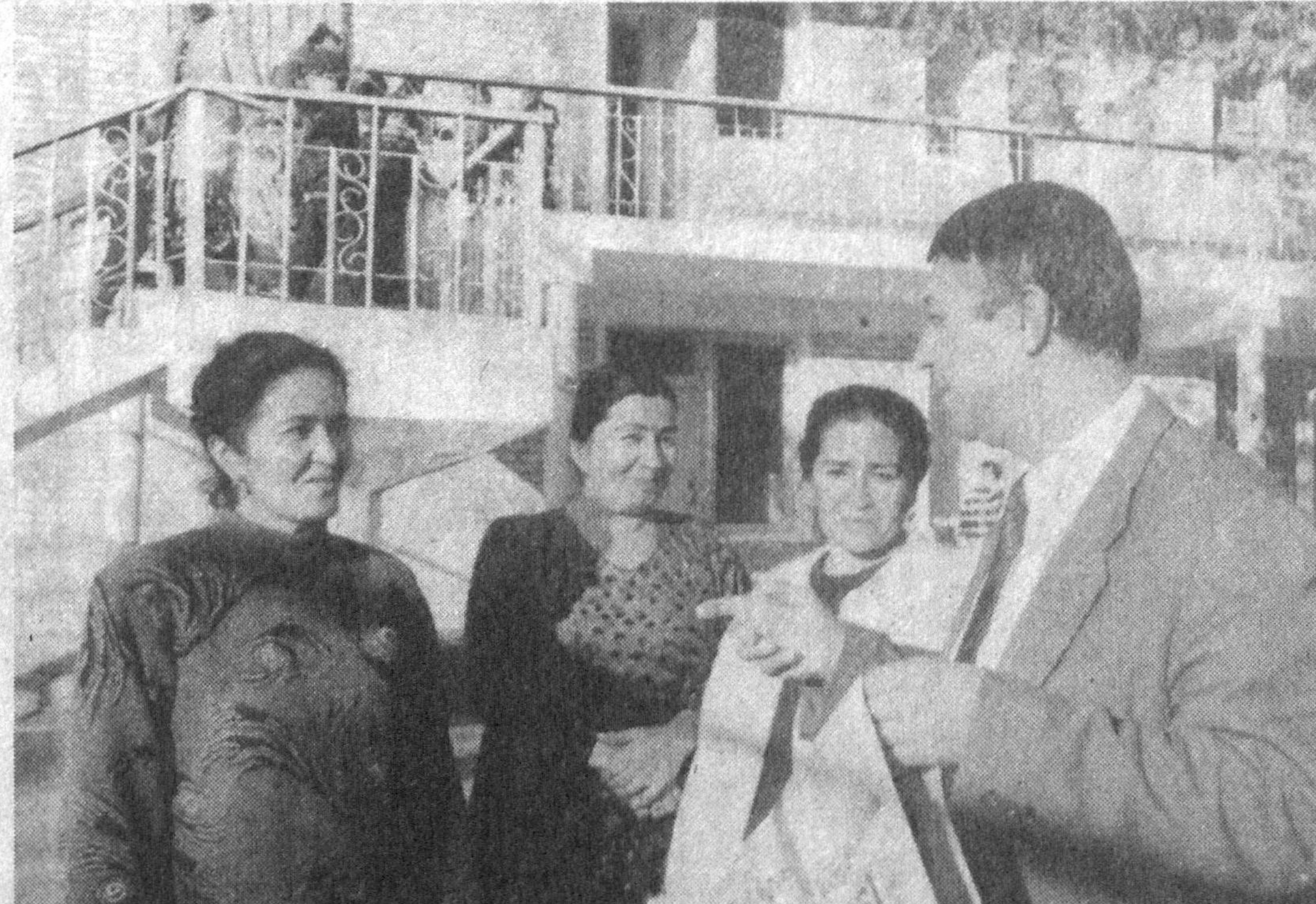
Тараққиётнинг муҳим шартларидан бири — меҳнатқашларнинг ўз ҳақ-ҳуқуқлари ва имтиёзларини билиши ҳамда улардан оқилона фойдалана олишидир. Шу боис ҳам Таълим ва фан ходимлари касба уюшмаси Қарши туман кўмитаси ўз фаолиятида бу масалага катта эътибор қаратиб келмоқда. Кўмита раҳбарлари, мутахассислар ва фаоллар иштирокида қўллаб-қувватлаш, йиғинлар ўтказилаётди.

Узгартиришлар билан янада мукамаллашган қонунлар мажмуаси суд-ҳуқуқ тизимини эркинлаш-тириш ва демократлашти-риш йўлида қўйилган му-