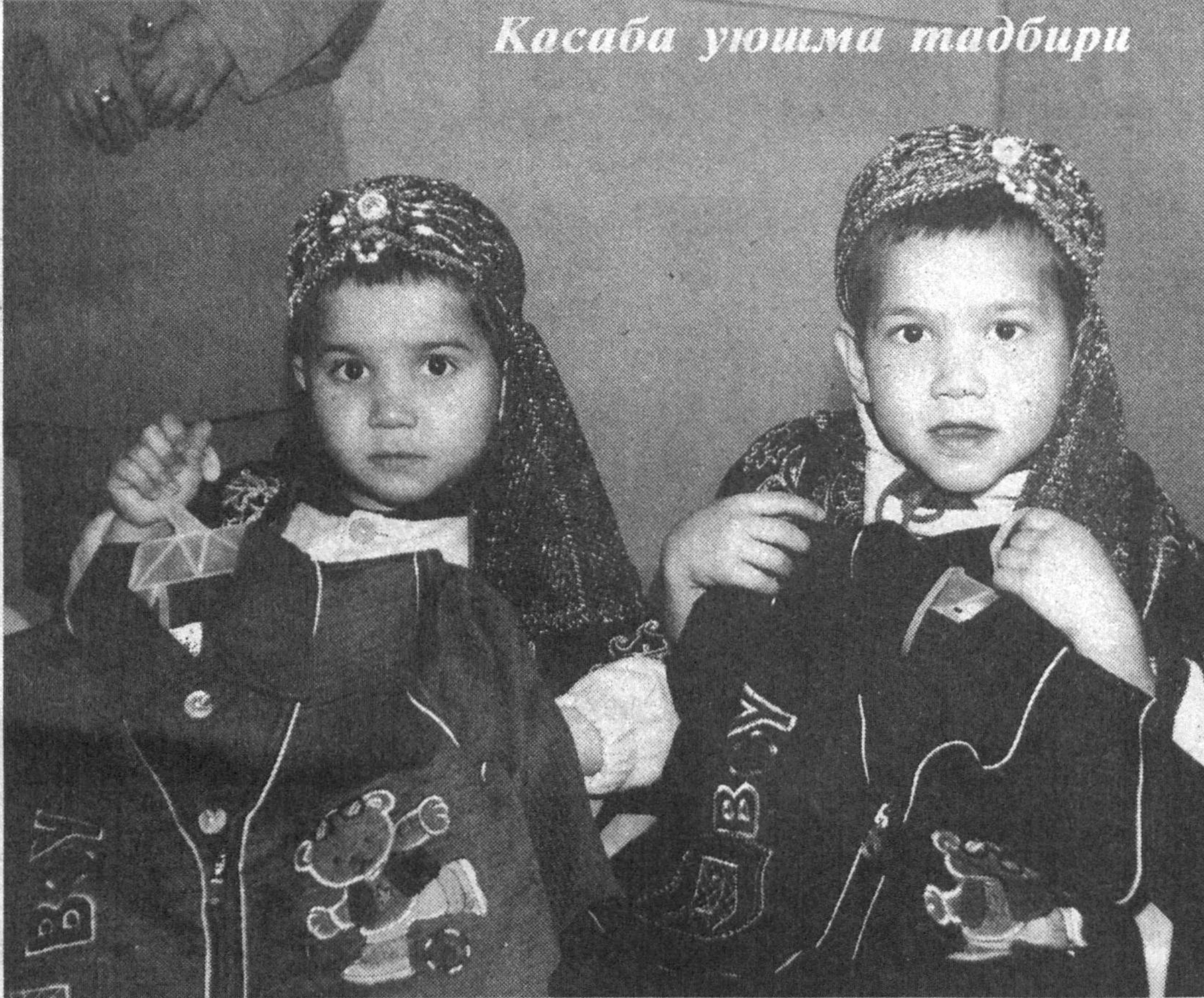
Касаба уюшма тадбири