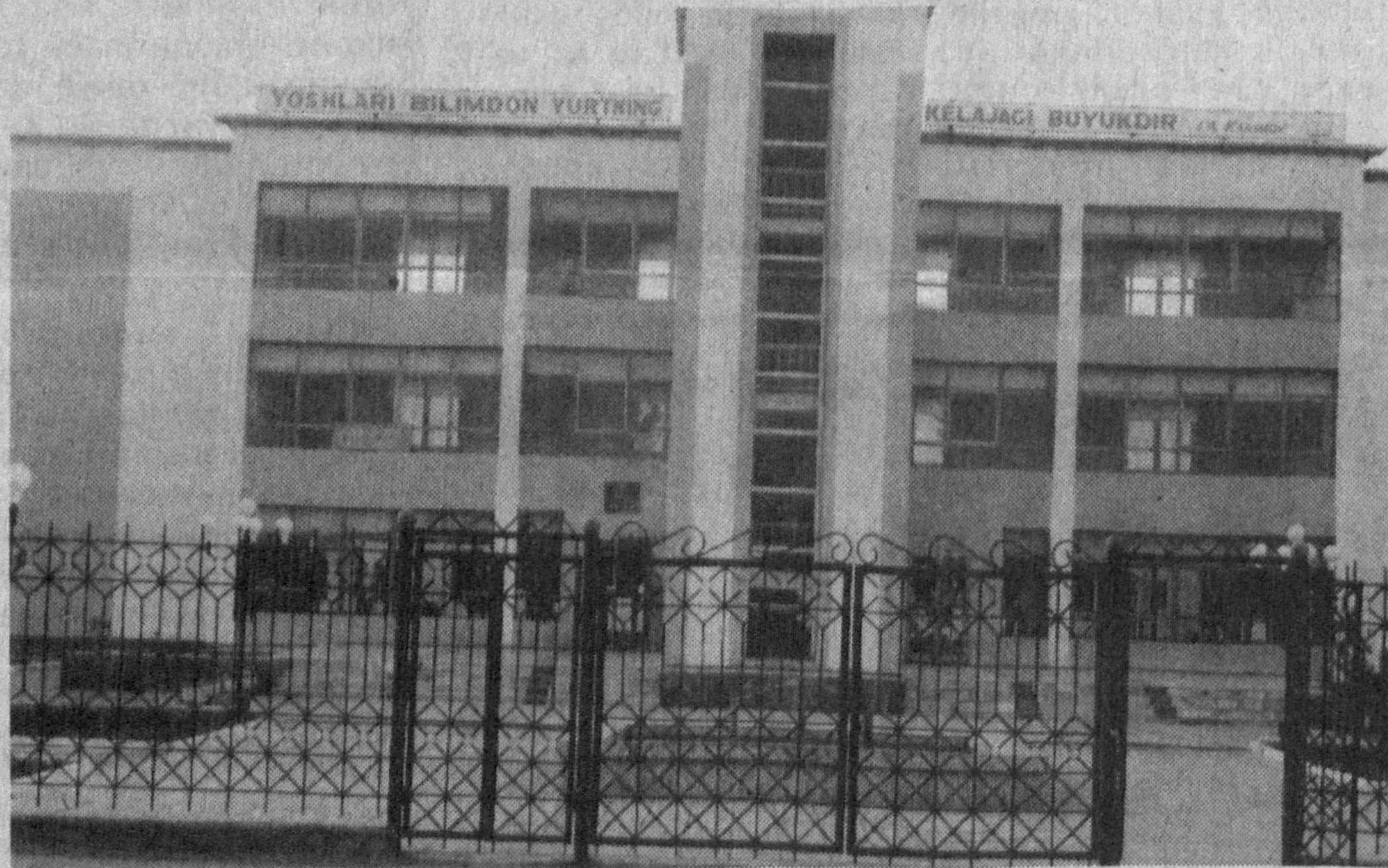
Суратда: Термиз иқтисодиёт коллежи.