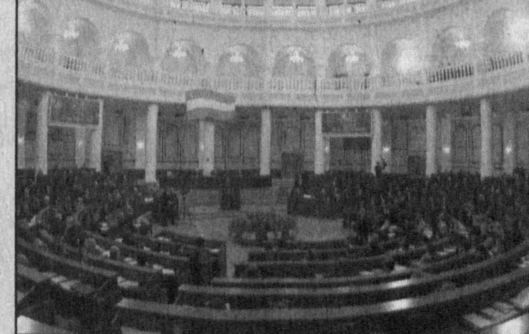
Конституциявий қонуни лойиҳаси қўйилмоқда. Бу лойиҳа, авваламбор, давлат бошқаруви масаласида, қонунчилик ҳокимияти бўлиши Олий Мажлис (Давоми 2-бетда)

Боқимандалик кайфиятига берилиш банк-ротлиққа етакловчи йўллар. Таассуфки, баъзи мутасаддилар лоқайдлиги ташкилотни ана шундай ахволга солиб қўймоқда. Утган йил Сирдарё вилоятида 37 та хўжалик юритувчи субъект банкрот деб эътироф этилгани фикримиз исботидир.