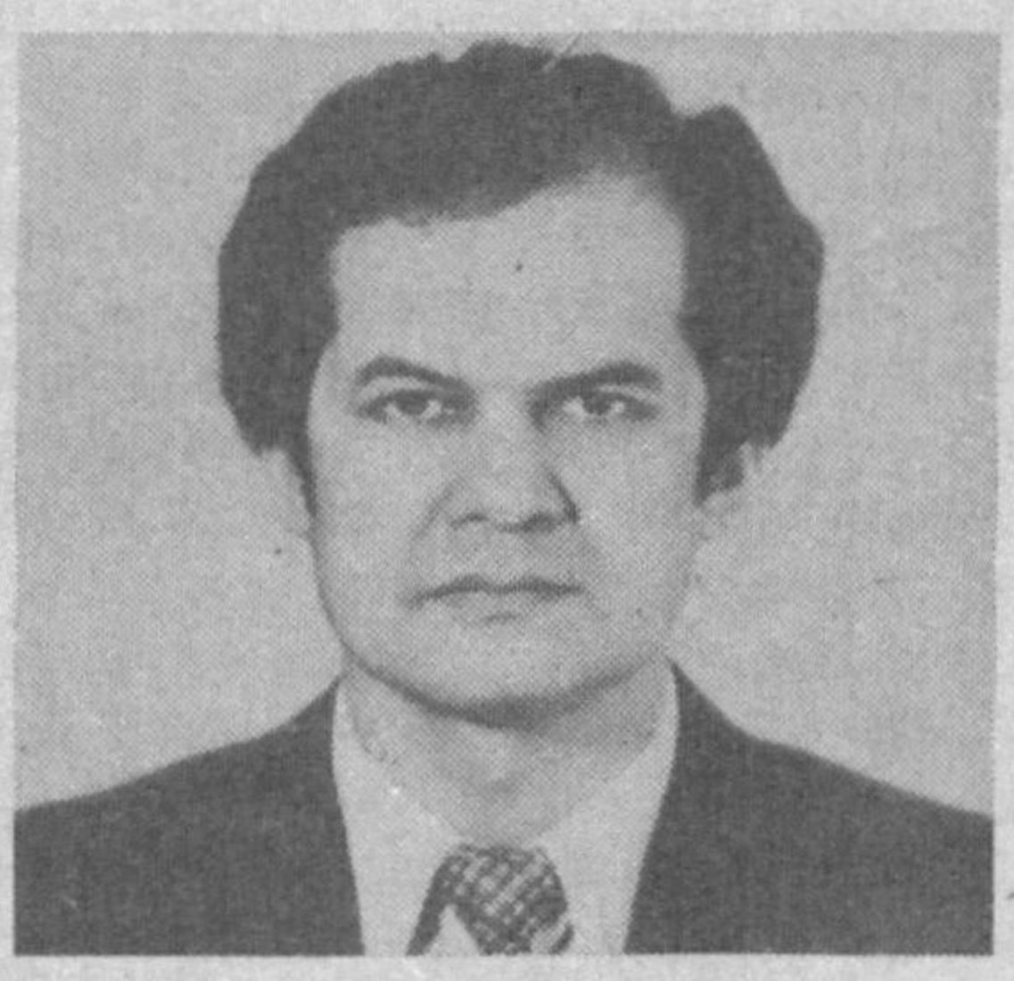
ЯРАТМИШДИР Қара Оллоҳ сену бизни нечук барно яратмишди...

Аё, Одам, сени деб ушбу хил дунё яратмишди, Заминда ризқ, самода шуълаи ифшо яратмишди.