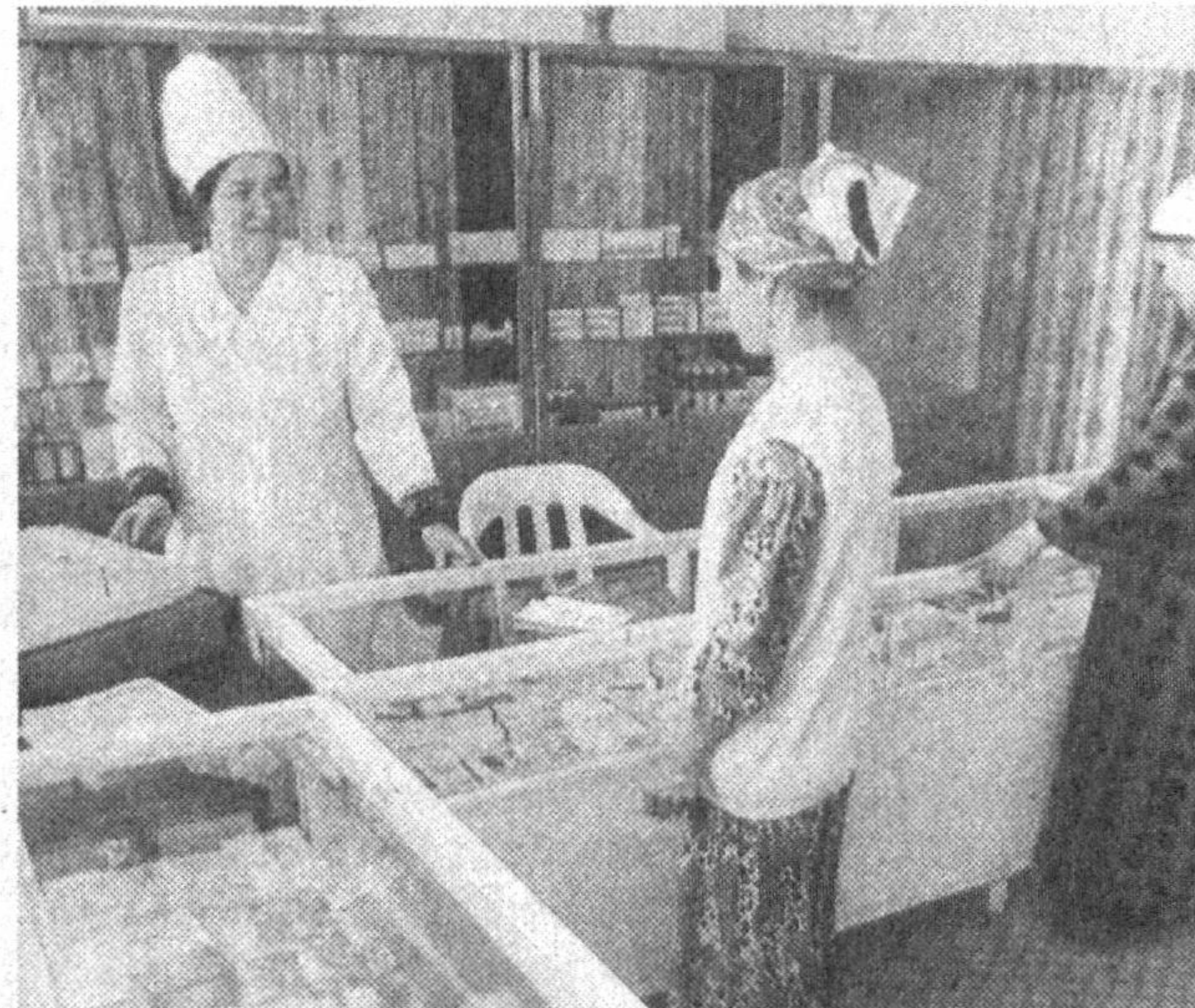
«Файзобод» қишлоғида врачлик пункти аҳолига хизмат кўрсата бош-лади. У Олтиариқ туман ҳокимлиги кўмағида куриб битказилди. Бу ерда аҳоли саломатлигини назорат қилиш ва тиклаш учун зарур барча даво-

яларга соғлиқларини ёхуд арзон баҳола-тиклаш учун йўлланма-лар берилди. Қатор кексаларни туманимиз-даги «Роббо», «Хумо», «ООО Гулнора-Анор», «Тропика», «Ноз-неънат» сингари дўконларга бирктиб қўйганмиз. Уларни ҳомийларимиз озиқ-ов-қатлар билан етарли