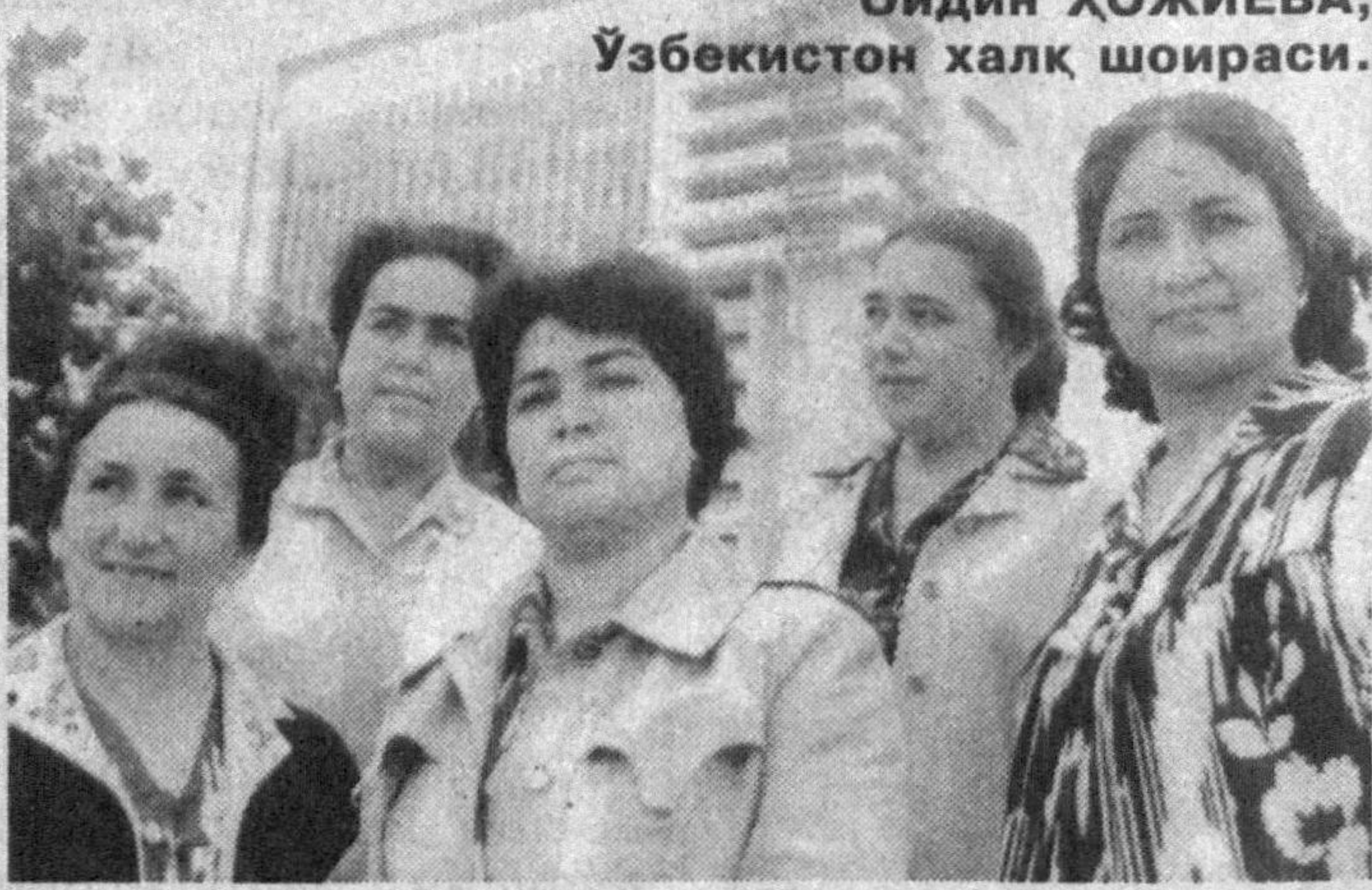
Кулбамни ёритди шамъи саодат.

Бунда ўчоғининг кулида — меҳрим, Ҳар гишти, сомони, гилида — меҳрим. Майин аллаларим тинглаб йиғлаган, Васса чўларининг тилида — меҳрим.