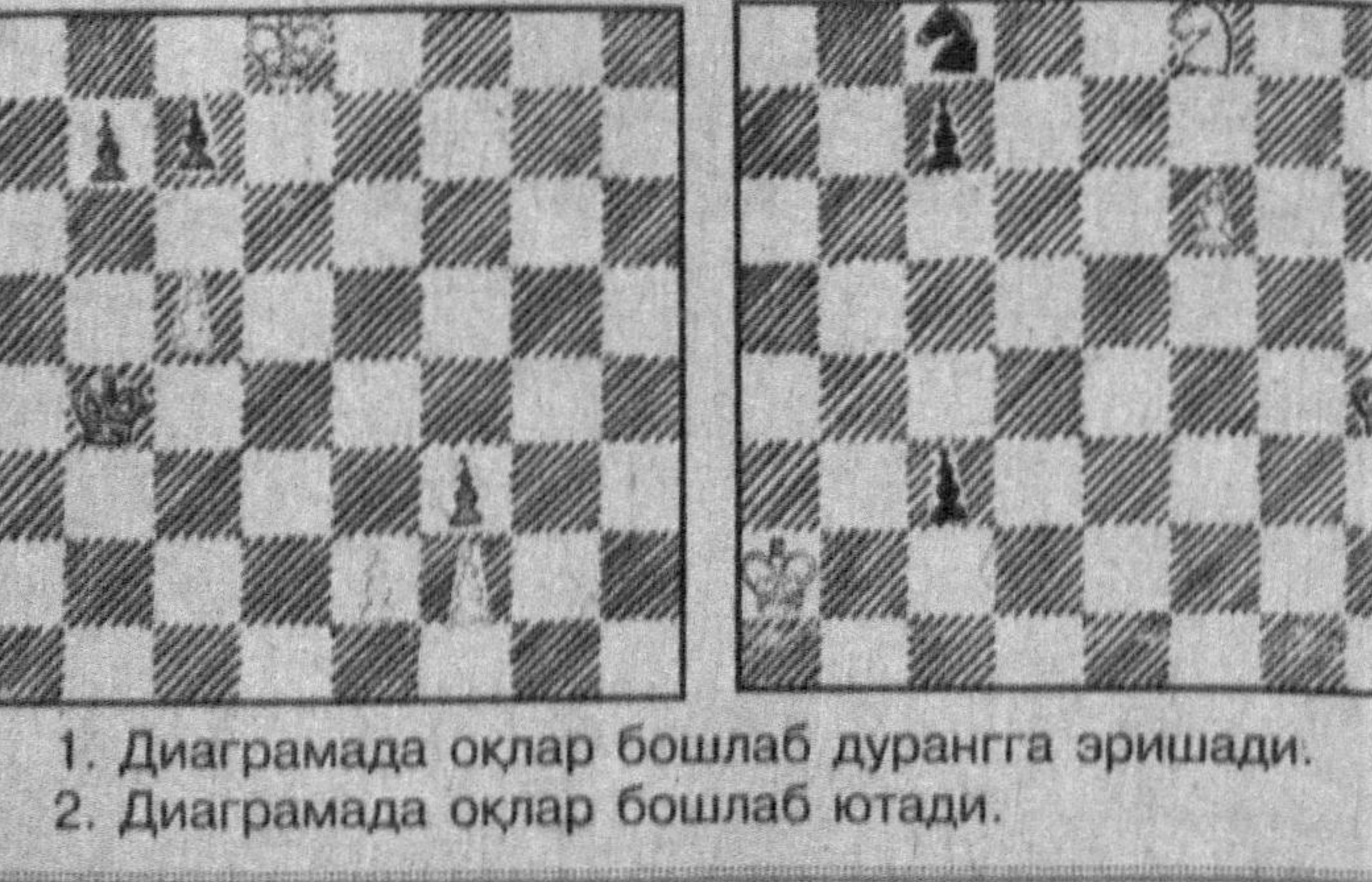
1. Диаграммада оқлар бошлаб дурангга эришади. 2. Диаграммада оқлар бошлаб ютади.