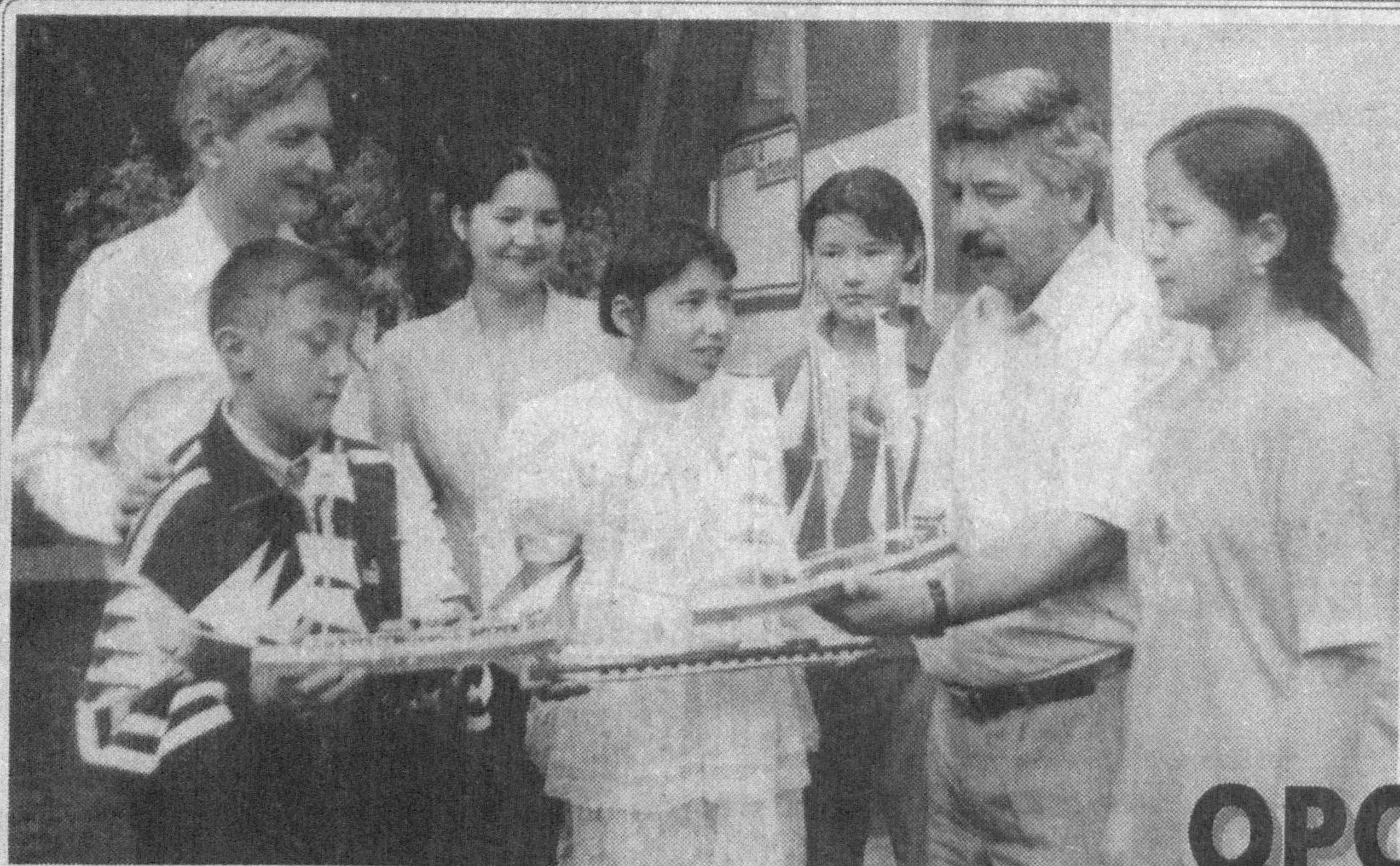
Шахрисабз туманидаги Беруний номи оромгоҳ дарвозаси ёнига келиб тўхтаган автобусдан тушган болалар теварак-атрофга ҳайрат ила боққан оромгоҳ томон юришди. Улар Коракалпоғистон Республикаси Кўнғирот туман мактаб ўқувчи-ёшлари. Анча барвақт тайёрлаб қўйилган дам олиш маскани Оролбўйидан ташриф буюрган ўқувчиларни Шахрисабзнинг мусаффо об-ҳавоси, муздек зилот суви ва бетакорор манзаралари билан қарши олди.

Ж.КОДИРОВ, «Сурхонтекстиль» хиссадорлик жамияти касаба уюшма кўмитаси раиси.