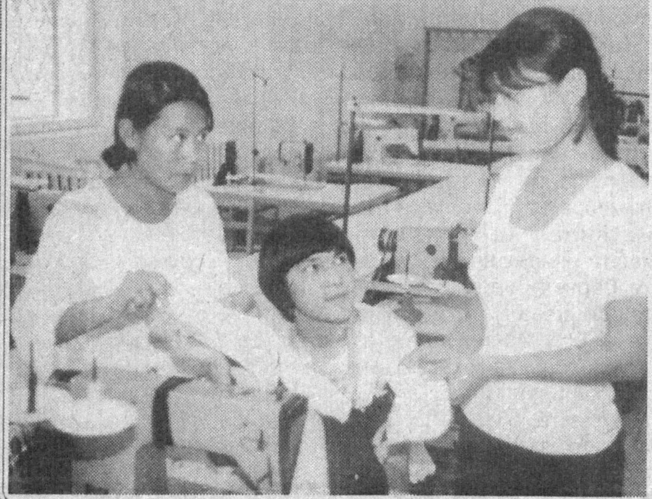
автоматика ва назорат ўлчов асбобларини йиғиш ҳамда уларга хизмат кўрсатиш сингари мутахассисликлар бўйича билим берилади. Шу-

Мамлакатимиз олий ва ўрта махсус ўқув муассасаларига кириш учун абитуриентлардан хужжатлар қабул қилиш жараёни бошланди. Кибрай туманидаги Энергетика касб-хунар коллежиде бу йил еттига мутахассислик бўйича иккидорли 200 нафарга яқин ўғил-қиз ўқишга қабул қилинади.