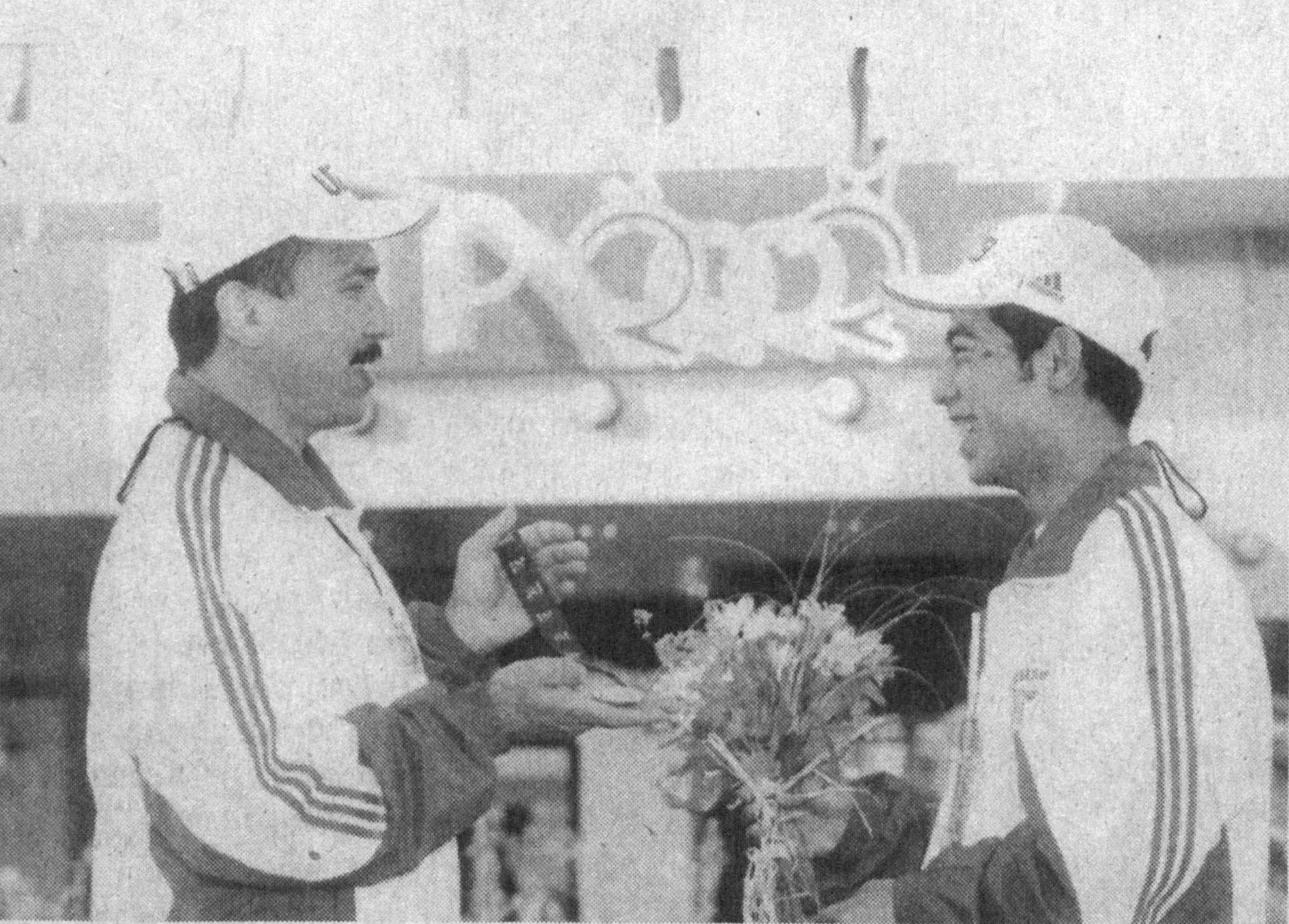
Москвада МДХ ва Болтикбўйи мамлакатлари ўсмирлари халқаро спорт ўйинлари ниҳоясига етди. Унда Ўзбекистон вакиллари ҳам иштирок этиб, сармолкли натижаларни қўлга киритди.

Ўз сафида 79 нафар ёшми бирлаштирган жамоамиз спортнинг самбо, юнон-рум кураши, теннис, стол тенниси, енгил атлетика, қиличбозлик, шахмат, сузиш, спорт гимнастикаси, бадий гимнастика турлари бўйича беллашди.