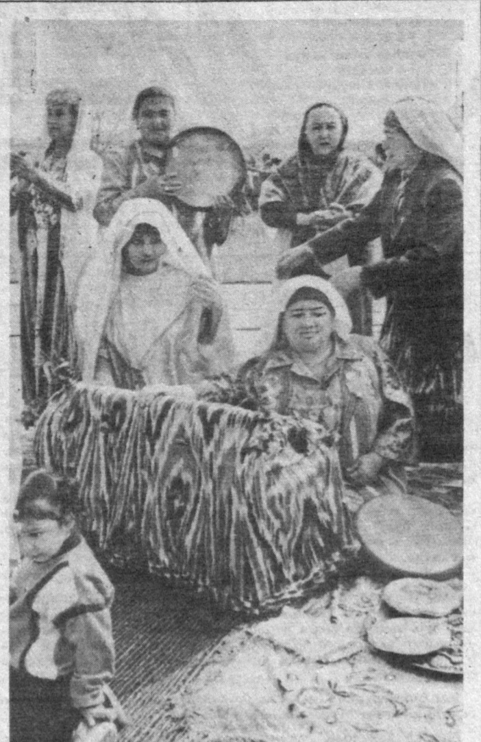
«Бешик боласи — бек боласи». Бу удумни аяқонларимиз авлоддан-авлодга етказиб келмоқдалар.