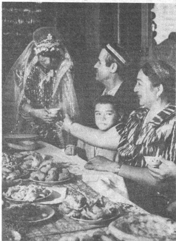
«Қўлларингиз дард кўрмасини келияжон!» — Қайнонанинг шундай ширин дуоси янги хонадонни чароғон этади.