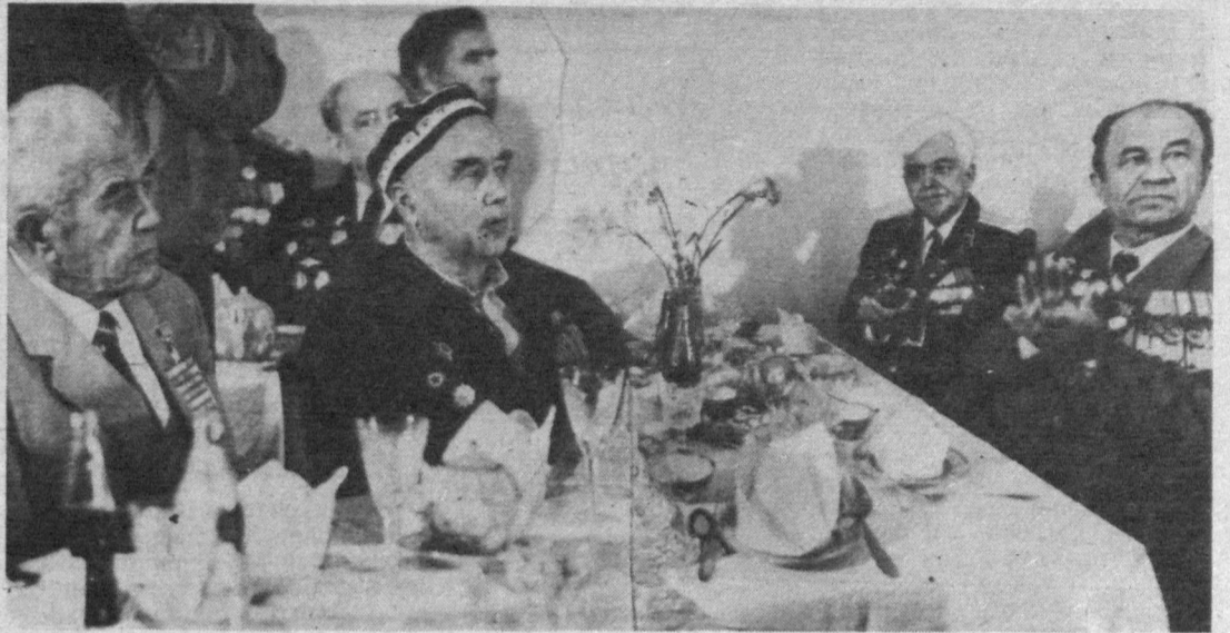
Фахрийлар бор — маҳаллаларда файз бор, борака бор. Уларнинг ҳаёт