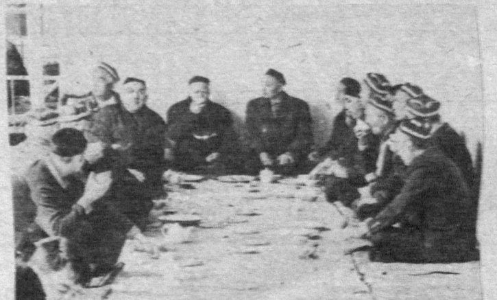
Дастурхон атрофида, бир паёла чой устида отагонлар суҳбатига мушарраф бўлишга не етсин.

Бир файласуфнинг қизи бор экан. Унга икки киши — бир бой ва бир камбағал совчи юборибди. Файласуф қизини камбағал йигитга берибди. Дўстлари ундан нега бундай қилдинг, деб сўрашса, шундай жавоб қилибди: — Давлатли йигитнинг эси пастроқ кўринади, ҳадемай мол-давлатидан ажралиб қолиши мумкин. Камбағал йигит эса зийрак ва эсли-хушли экан. Эси бор одамнинг сал вақтда бойиб кетишига ишонса бўлади. Тўпловчи: Ҳамид АБДУЛЛАЖОНОВ .