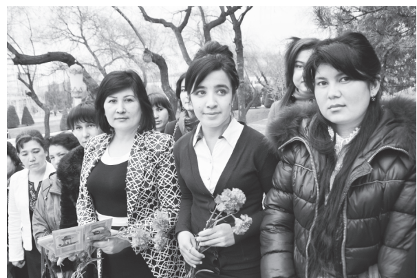
«Давоми. Бошланиши 1-бетда».

Улуг шоир асарларида осуда ҳаёт, тинчлик-хотиржамлик орзу қилинган. Шукри, биз бугун ана шундай фаровон турмушдан баҳрамандмиз. Ёшларимиз ул зотнинг асарларидаги қаҳрамонлар каби эзгулик сари бел боғлаб, юрт равнақиға ҳисса қўшишга чоғланмоқдалар. Бунини шу кунларда Қорақалпоғистон Республикаси, вилоятлар ҳамда Тошкент шаҳрида буюқ мутафаккир шоир Алишер Навоий таваллудининг 574 йиллиғига бағишлаб ўтказилаётган маърифий тадбирлар, адабий кечалар, илмий анжуманлар, мушоиралар мисолида ҳам кўриш мумкин.