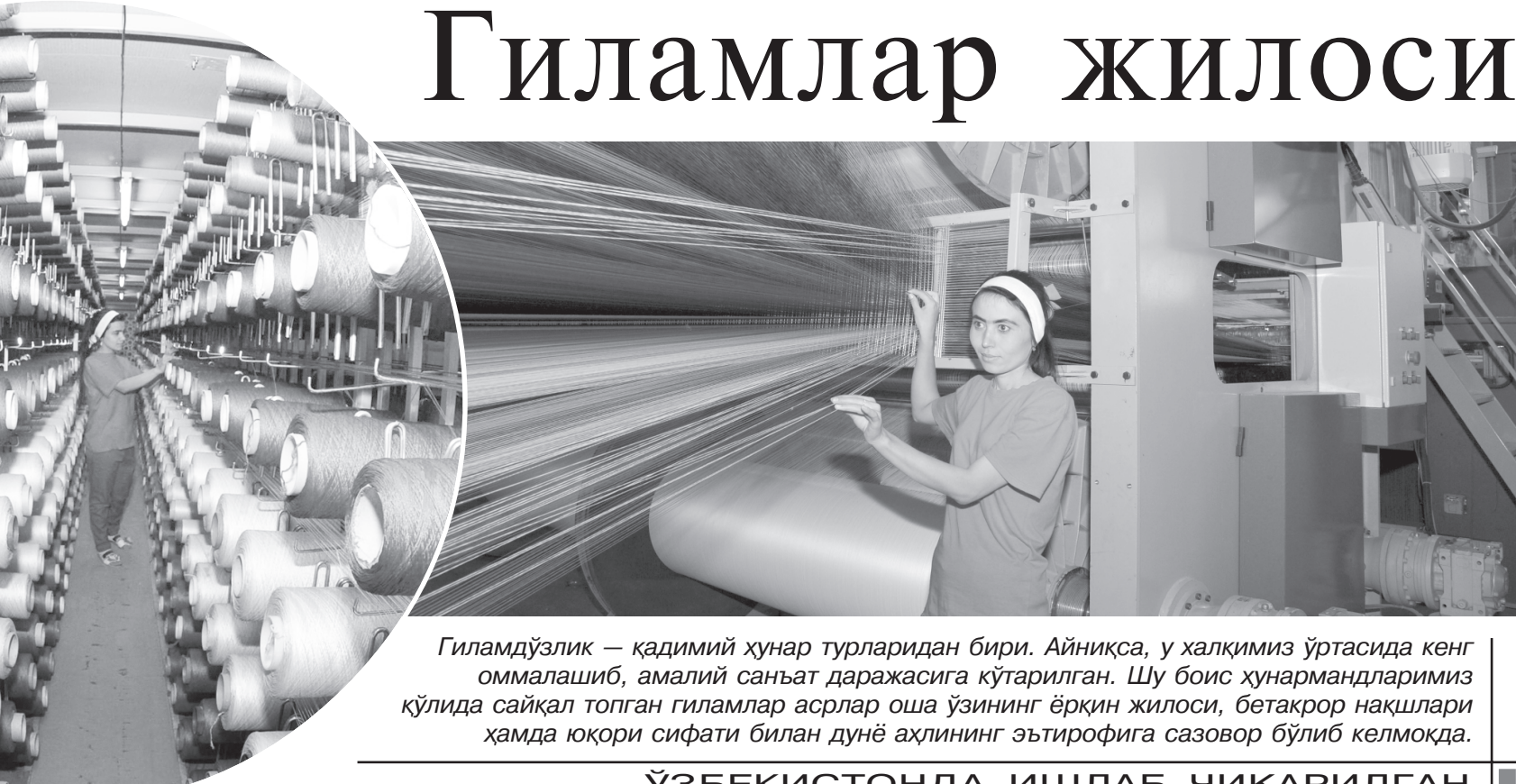
Гиламдўзлик — қадимий ҳунар турларидан бири. Айниқса, у халқимиз ўртасида кенг оммаланиб, амалий санъат даражасига кўтарилган. Шу боис ҳунармандларимиз қўлида сайқал тоған гиламлар асрлар оша ўзининг ёрқин жилоси, бетакрор нақшлари ҳамда юқори сифати билан дунё аҳлининг эътирофига сазовор бўлиб келмоқда.