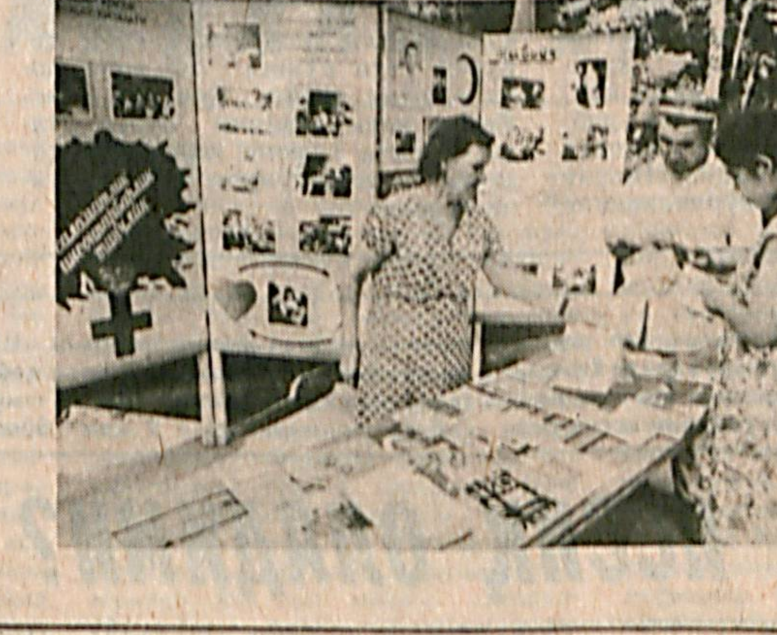
СУРАТЛАРДА: истироҳат боғида ўтказилган байрамдан лавҳалар.

Кеча Тельман номдаги маданият ва истироҳат боғига таширф буюрган кишилар Тошкентнинг «ОқШОМ» газеталарининг байрами бўлди.